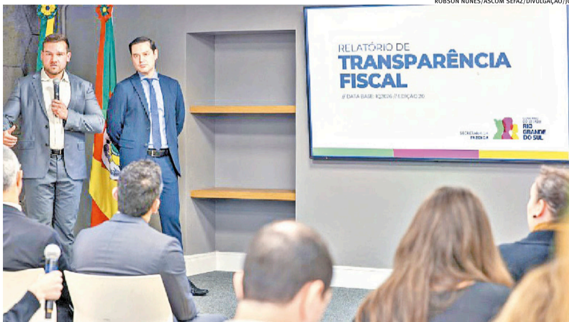
Técnicos da Secretaria da Fazenda apresentaram Relatório de Transparência Fiscal dos quatro primeiros meses

12% da receita estadual para a saúde e 15% para educação, em que a cada exercício o Estado terá de aumentar o percentual das receitas até que se alcance a proporção estabelecida pela Constituição Federal.