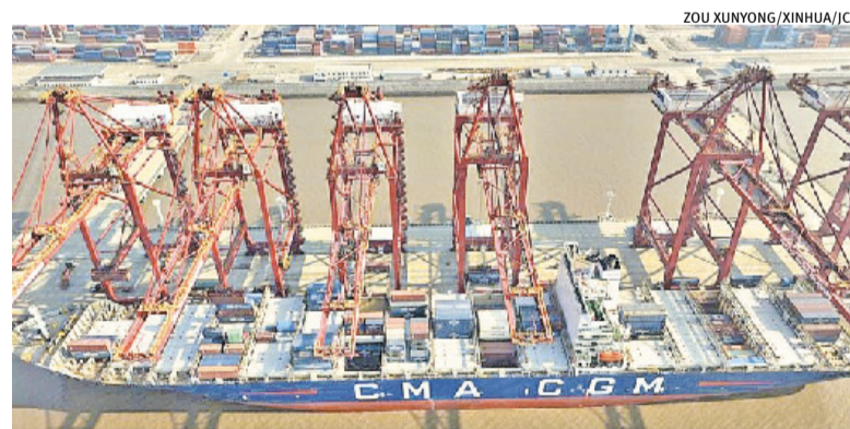
Na comparação com o 1º tri de 2025, envios ao exterior tiveram alta de 7,4%