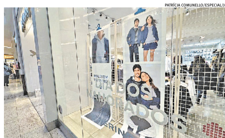
Shoppings despontam como primeiro destino das compras da data

mais disposto a investir no presente, buscando itens de maior valor agregado e experiências mais qualificadas", valoriza o presidente do Sindilojas POA, Arcione Piva, em nota. O cartão de crédito parcelado lidera os pagamentos (33,7%), seguido pelo Pix (29,5%). A CDL POA também fez pesquisa, ouvindo mais de 1.3 mil pessoas, com boas pistas de como vai ser a data para pautar os lojistas. Os presenteados principais serão cônjuges (43,1%) e namorado/a (40,1%). Os presentes mais requisitados serão roupas (22,6%), perfumaria (21,2%) e cestas de presentes (7,6%). Os consumidores devem ir às compras na semana da data (48%). Shopping lidera como local de destino (30,3%), seguido por internet (24,3%) e loja de rua (12,9%). Este ano os gastos serão de R$ 201,00 a R$ 500,00 (35,1%) e de R$ 101,00 e R$ 200,00 (28,8%). O pagamento será com cartão de crédito parcelado (28,5%), Pix (21,2%), cartão de crédito (20,5%) e débito (19,2%) e dinheiro (9,6%). Viagens ou passeios são indicados por 36,1% dos entrevistados.