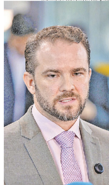
Ministro diz que o Brasil fará todo o esforço para evitar prejuízos