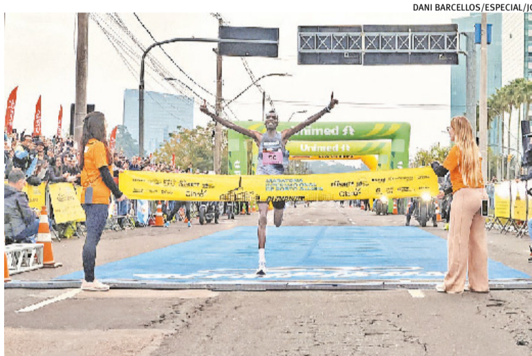
Queniano Daniel Kiprono Sang estabeleceu recorde em provas no Brasil

A edição deste ano também chamou atenção pela presença de atletas estrangeiros. Um grupo de cerca de 50 corredores vindos de Montevideú, no Uruguai, participou da programação da maratona.