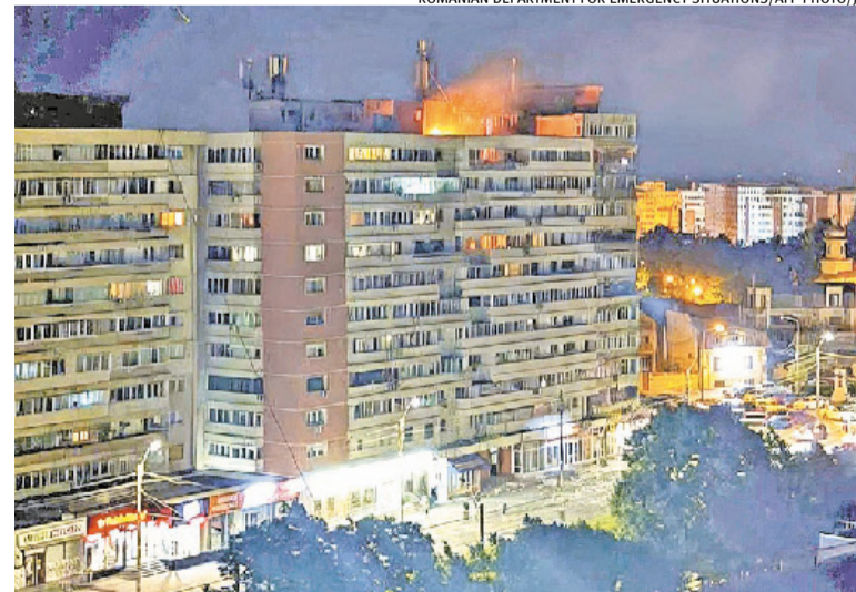
Cidade romena de Galati fica a cerca de 20 km de fronteira com Ucrânia