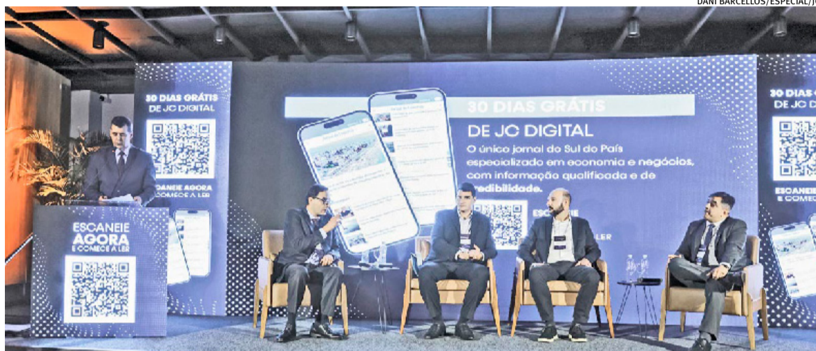
Encontro realizado na ACI de Ijuí na quinta-feira reuniu lideranças políticas e empresariais da região

“apoiar iniciativas como o Mapa reforça o compromisso com o desenvolvimento regional e auxilia na construção de um ambiente mais forte, inovador e colaborativo para os associados, para Ijuí e para a região”.