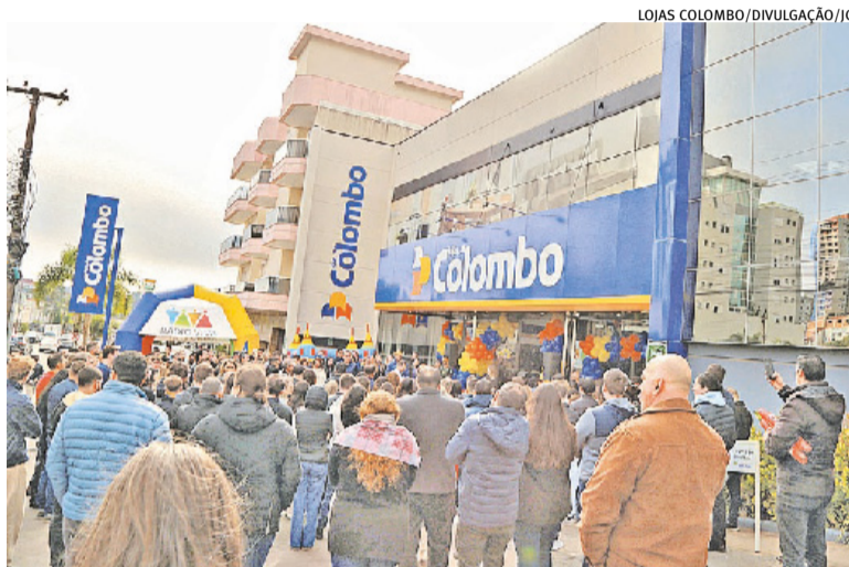
Filial aberta em Farroupilha, sede da rede, foi a terceira nova de 2026