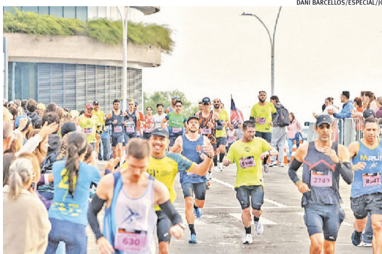
Organização comemora aumento de 20% no número de participantes

Parte deles correu as provas de 10 e 21 quilômetros no sábado, e neste domingo permaneceram na arquibancada para apoiar amigos que encararam os 42 quilômetros.