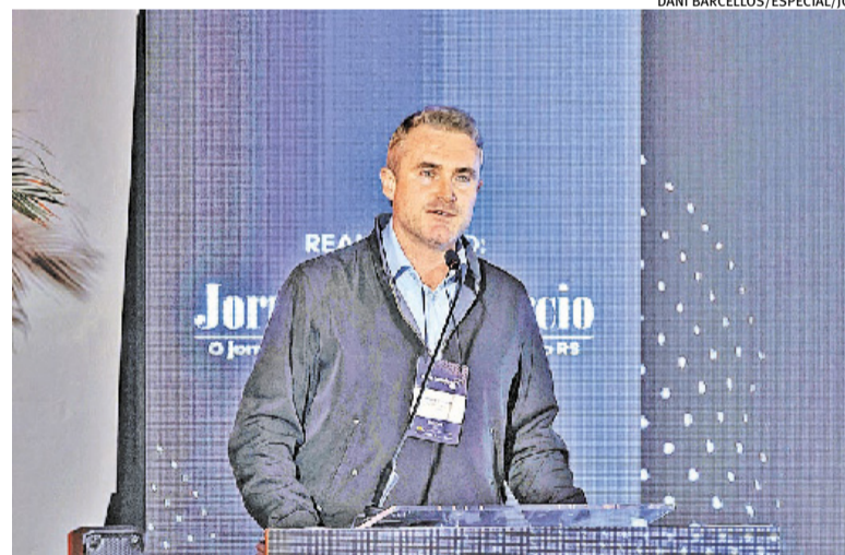
Prefeito de Ijuí enfatizou a necessidade de buscar ideias e soluções