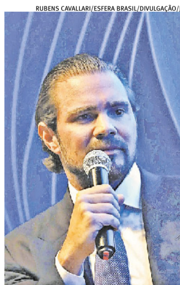
Vorcaro teve primeira proposta rejeitada por falta de consistência