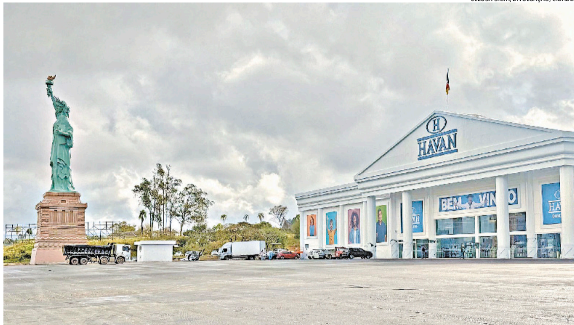
Unidade no Vale do Paranhana teve investimento de R$ 100 milhões e deve gerar cerca de 200 vagas de emprego na cidade

A comunidade de Taquara e moradores de toda a região do Vale do Paranhana e Serra Gaúcha vivem a expectativa para um dos momentos mais aguardados dos últimos tempos no município: a inauguração da Havan Taquara, que ocorre neste sábado (30), às 10h. A nova megaloja está localizada na avenida Oscar Martins Rangel, às margens da ERS-115, no bairro Fogão Gaúcho.