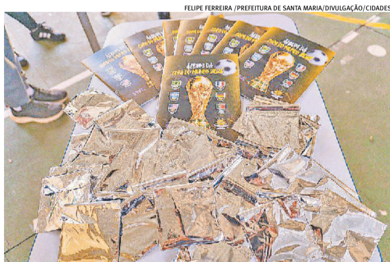
Cada aluno recebeu um álbum junto a um pacote com sete figurinhas na entrega

A Escola Júlio do Canto atende 215 estudantes da Rede Municipal de Ensino, todos envolvidos no projeto do álbum da Copa do Mundo, que foi impresso a partir de doações e com apoio da Editora e Gráfica Caxias.