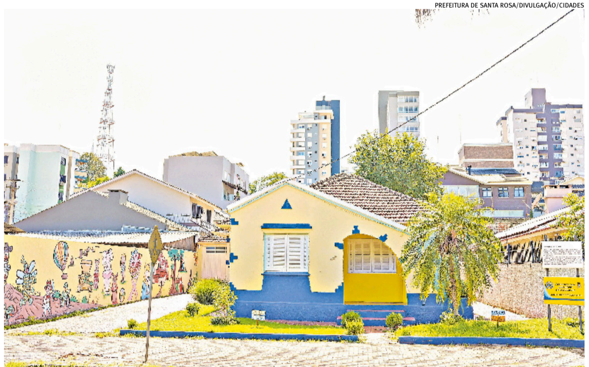
Município assinou um contrato de cogestão com o Lions Clube para reforma e reabertura da casa onde a apresentadora morou

De acordo com ele, a propriedade estava em estado de abandono, com pintura desgastada, grama alta, além de ser frequentada de forma inadequada. Desde a adoção do local, o grupo planejava fazer reformas no interior do imóvel a fim de transformá-lo em um memorial à cantora. No entanto, atualmente não há nenhum tipo de acervo ou de mobília dentro da propriedade. Mesmo que em 2021, com a gravação do documentário da Xuxa para o Globoplay, o local tenha sido remobiliado como era quando a gaúcha morava na casa, o acervo foi devolvido e o interior da propriedade permaneceu vazio.