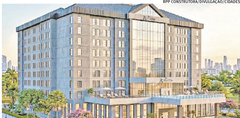
Projeto, com 300 apartamentos e infraestrutura deve custar cerca de R$ 150 milhões

A administradora vencedora do certame tem parceria com a Atlântica Hospitality International, maior operadora multimarcas de hotéis da América do Sul, responsável pela administração de diversos hotéis no Brasil sob bandeiras internacionais renomadas, como Radisson, Hilton e Choice Hotels. A empresa possui atualmente mais de 197 empreendimentos em operação no país, consolidando-se como líder no setor hoteleiro nacional.