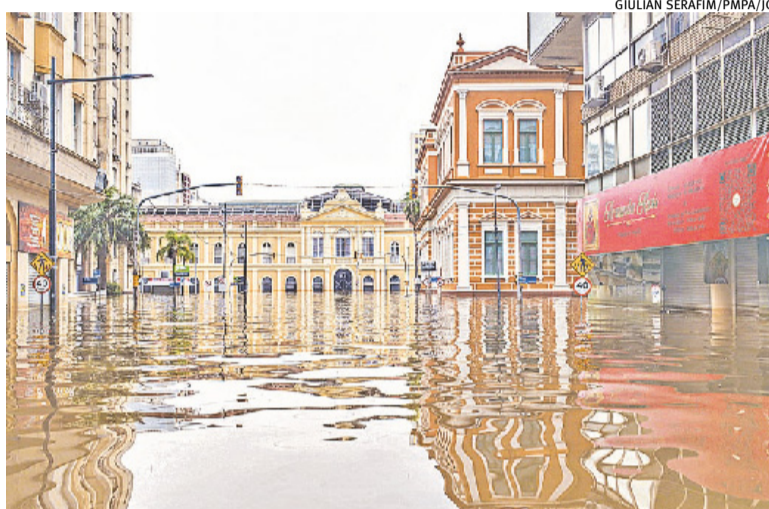
Considerando perdas com as cheias, Estado só fica atrás de Santa Catarina

Um dado preocupante revelado no estudo da CNM é da res-