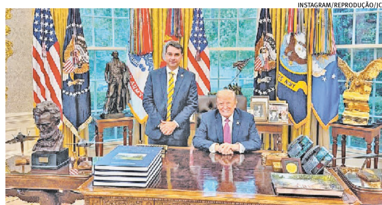
Pré-candidato ao Planalto foi recebido pelo norte-americano na Casa Branca

O senador disse ter solicitado apoio da Embaixada do Brasil nos EUA para receber jornalistas e dar uma coletiva de imprensa, mas afirmou que não recebeu resposta.