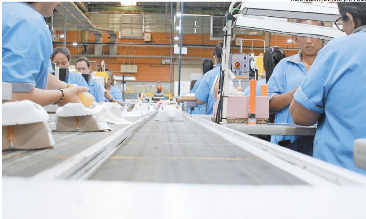
De acordo com números consolidados pela prefeitura, no primeiro semestre desse ano foram criados 2.747 negócios

A cidade de Novo Hamburgo registrou um crescimento expressivo na abertura de empresas nos primeiros meses de 2026. Os números consolidados apontam que o município alcançou um aumento de cerca de 50% em relação ao mesmo período de 2024.