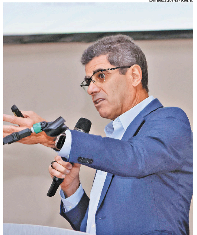
Oliveira afirma que Brasil tem avançado na pauta de defesa comercial

Sobre as eleições presidenciais de 2026, Oliveira diz que o setor aguarda medidas que promovam a queda das taxas de juros e o controle da inflação. Fatores que, segundo ele, são essenciais para estimular o consumo na ponta final e viabilizar novos investimentos.