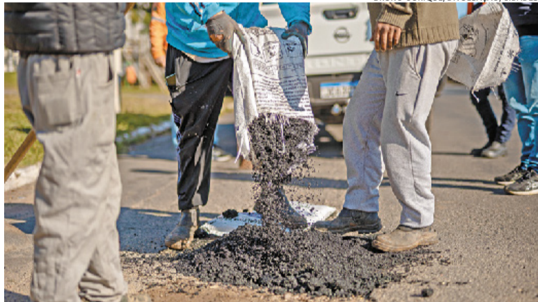
Buracos com até 50 centímetros de diâmetro serão fechados com asfalto frio