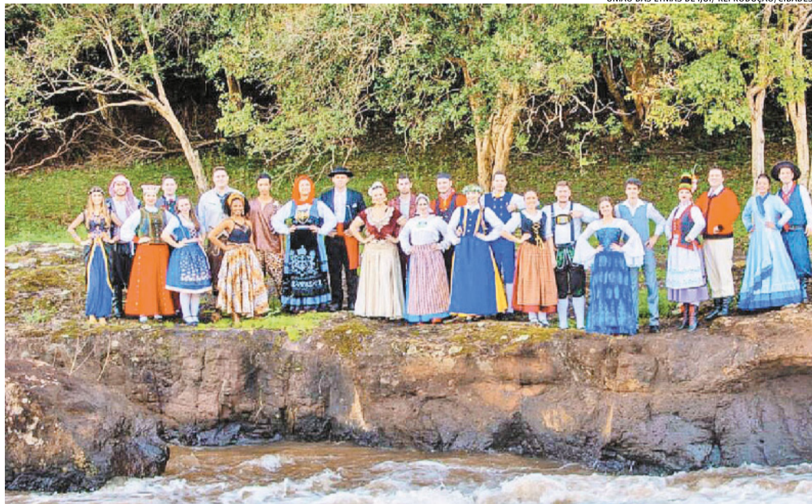
Entidade que reúne os grupos na cidade foi criada em 1994 e, em 2026, deu reconhecimento a argentinos, uruguaios e franceses