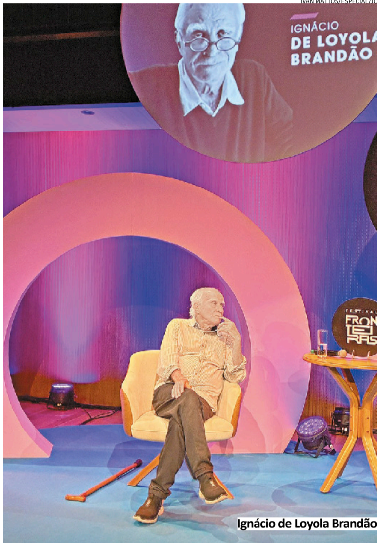
Ignácio de Loyola Brandão