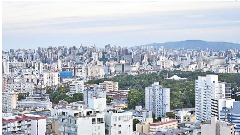
Construções poderão passar de 40 andares em Porto Alegre