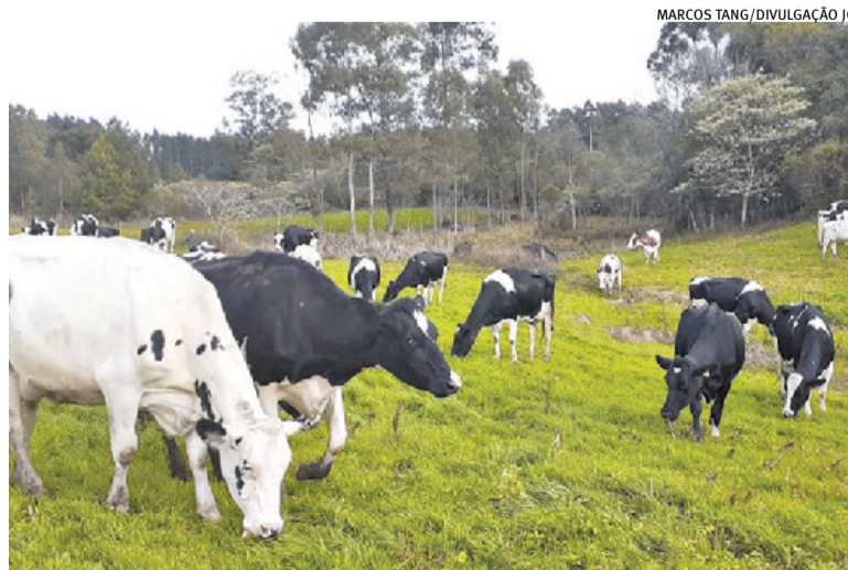
Conjuntura e o clima comprometeram desempenho nos tambos

A mudança no perfil da atividade ocorreu mesmo em um cenário de valorização nominal do leite ao longo das últimas décadas, o que reforça a percepção de que o principal desafio da cadeia deixou de ser apenas o preço recebido pelo produtor e passou a envolver escala, eficiência e capacidade de investimento.