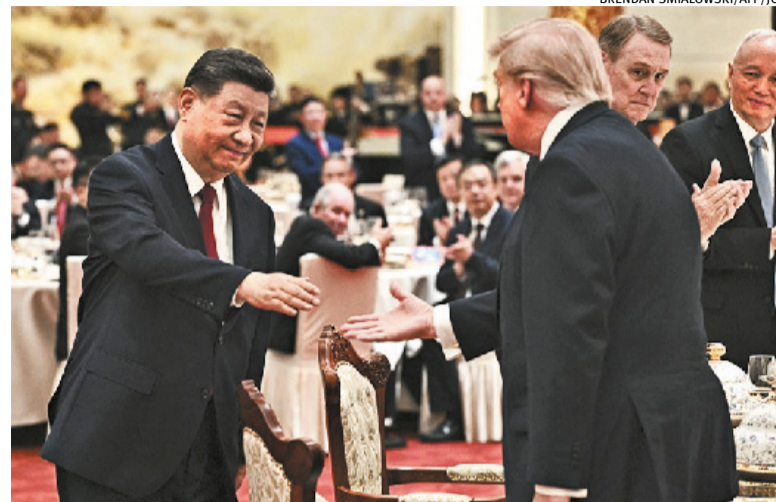
Xi Jinping disse ter tido “trocas aprofundadas” com Trump

“Nós construímos uma relação fantástica. Nós nos demos bem. Quando houve dificuldades, nós as resolvemos. Eu ligava para você, e você ligava para mim, e sempre que tínhamos um problema - as pessoas não sabem disso