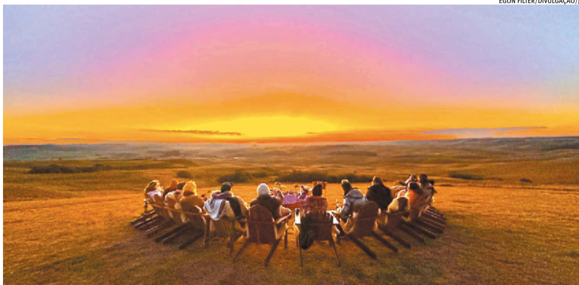
Pesquisa do Ministério do Turismo aponta que 36% dos brasileiros preferem viagens voltadas ao silêncio e à natureza