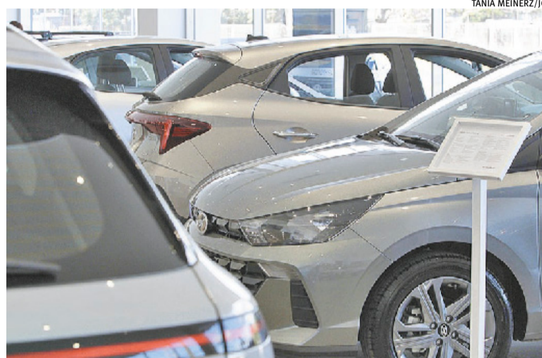
Custo-benefício, conforto e status determinam a compra de seminovos

Apesar da volatilidade do mercado, os veículos vendidos nas revendedoras têm valores que variam de R$ 80 a R$ 100 mil, predominantemente. Em geral, o público que busca seminovos e usados