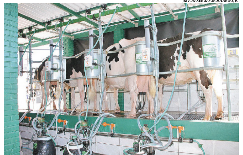
Demanda aquecida e produção em baixa sustentam a valorização

Nesta semana, o Conseleite RS encaminhou um ofício ao go-