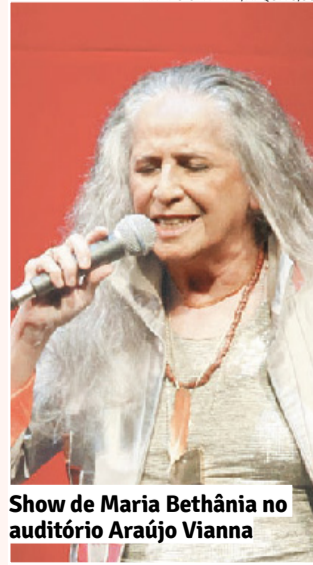
Show de Maria Bethânia no auditório Araújo Vianna