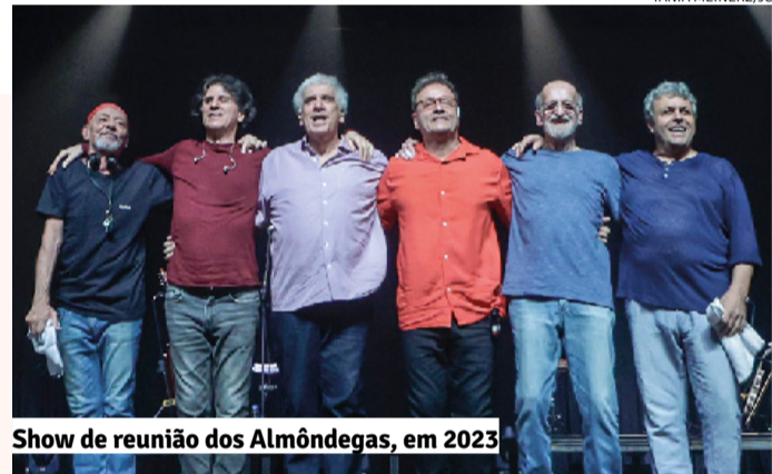
Show de reunião dos Almôndegas, em 2023