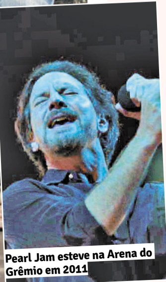
Pearl Jam esteve na Arena do Grêmio em 2011