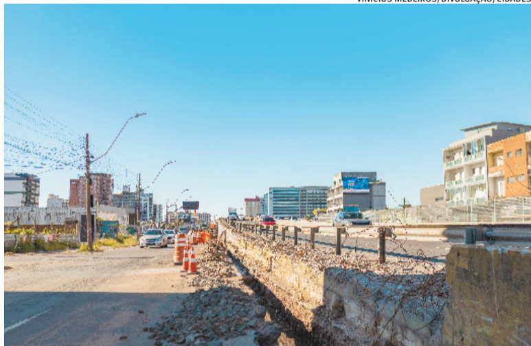
Mudanças ocorrem em função da montagem de vigas da obra no viaduto da rodovia

📍 BAGÉ - A Embrapa Pecuária Sul realizou uma capacitação destinada aos técnicos da Emater/RS-Ascar da regional de Bagé. A ação integra o programa Operação Terra Forte e teve como objetivo promover a atualização técnica dos profissionais que atuam na assistência a produtores rurais da região, com foco na melhoria dos sistemas de produção, especialmente relacionados ao solo, recuperação de áreas e sustentabilidade da pecuária. Durante os dois dias de programação, os participantes acompanharam diversas atividades. Entre os temas abordados estiveram alternativas de cultivares forrageiras, qualidade de sementes, implantação e manejo de pastagens, integração lavoura-pecuária (ILP), manejo e melhoramento de campo nativo, além do controle de plantas invasoras.