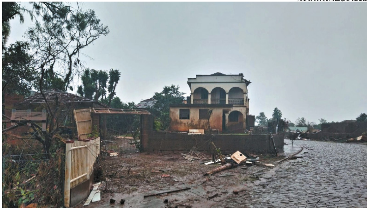
Área, conhecida como Pinguela, foi devastada pela enchurrada de 2024; local era conhecido pelo histórico de vulnerabilidade