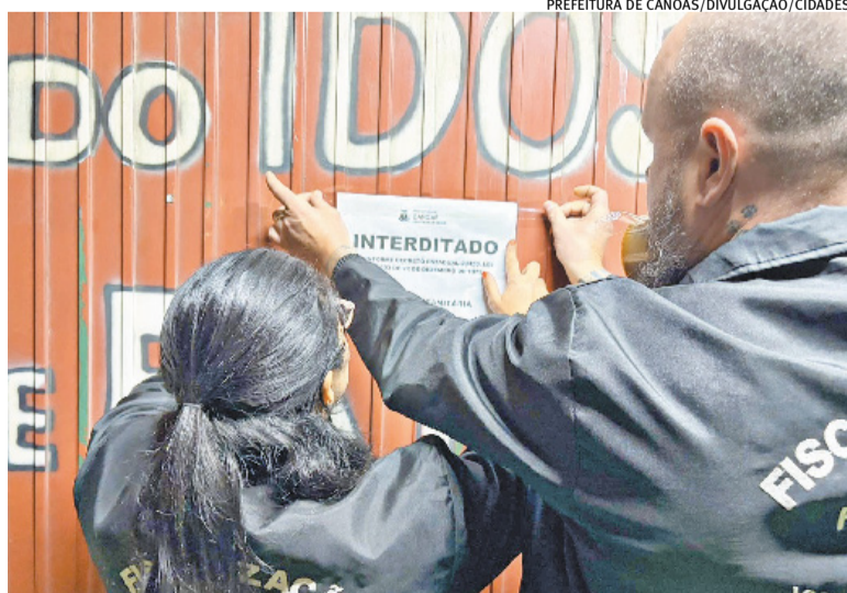
Fiscalizações observam questões ligadas à estrutura e ao bem-estar dos moradores