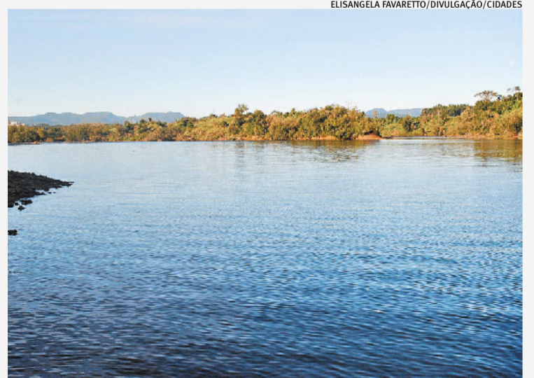
Meteorologista afirma que cenário das bacias hidrográficas do RS ainda é incerto

“Mesmo em cenários de El Niño de maior intensidade, não há garantia de repetição de eventos extremos específicos, como os registrados em maio de 2024”, esclarece.