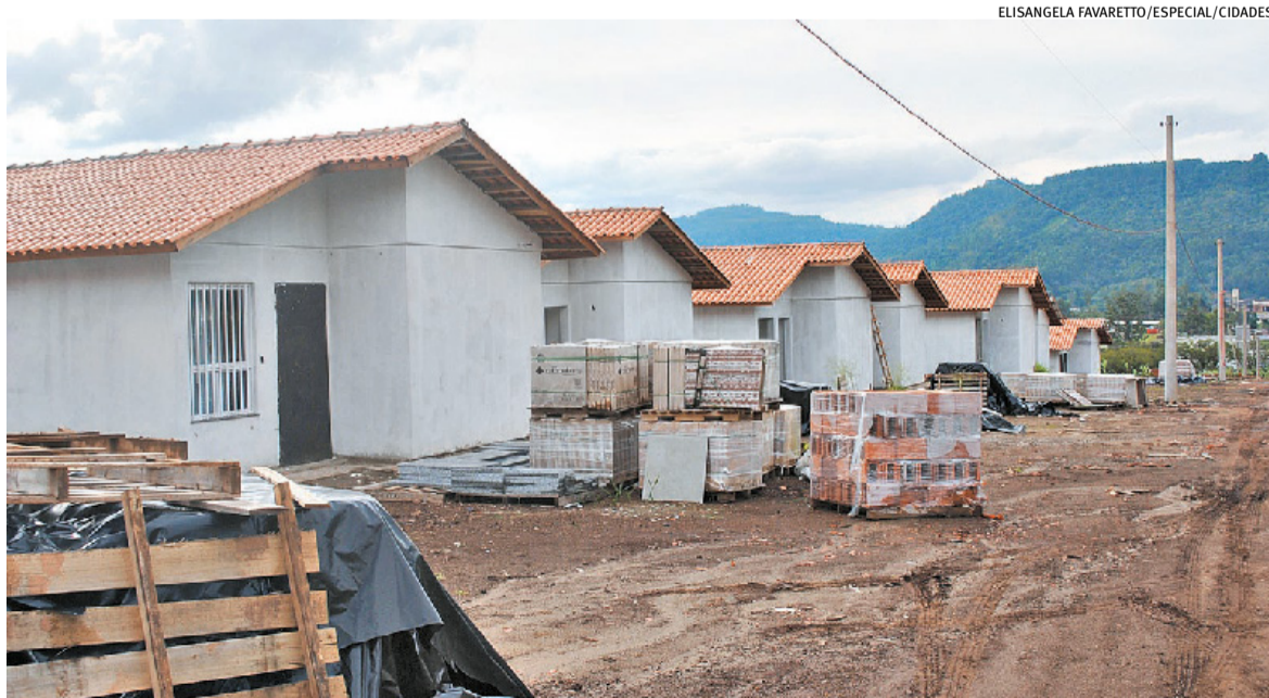
Somente na cidade, mais de 1,5 mil residências foram atingidas pelas três enchentes, duas em 2023 e a de maio de 2024

Na esfera federal, pelo “FAR Calamidade”, está sendo feita a construção de 100 apartamentos no loteamento Novo Paraíso, com entrega prevista para dezembro deste ano, além da confirmação de mais 800 unidades. No Compra Assistida, foram viabilizadas 566 moradias. Ainda são 50 unidades em fase de licitação pelo Fundo Nacional de Habitação de Interesse Social para cidade com até 50 mil habitantes, que é uma extensão do Minha Casa, Minha Vida e 50 previstas pelo MAB Entidades, que serão construídas em área doada pela Câmara do Comércio, Indústria, Serviços e Agronegócio de Estrela (Cacis).