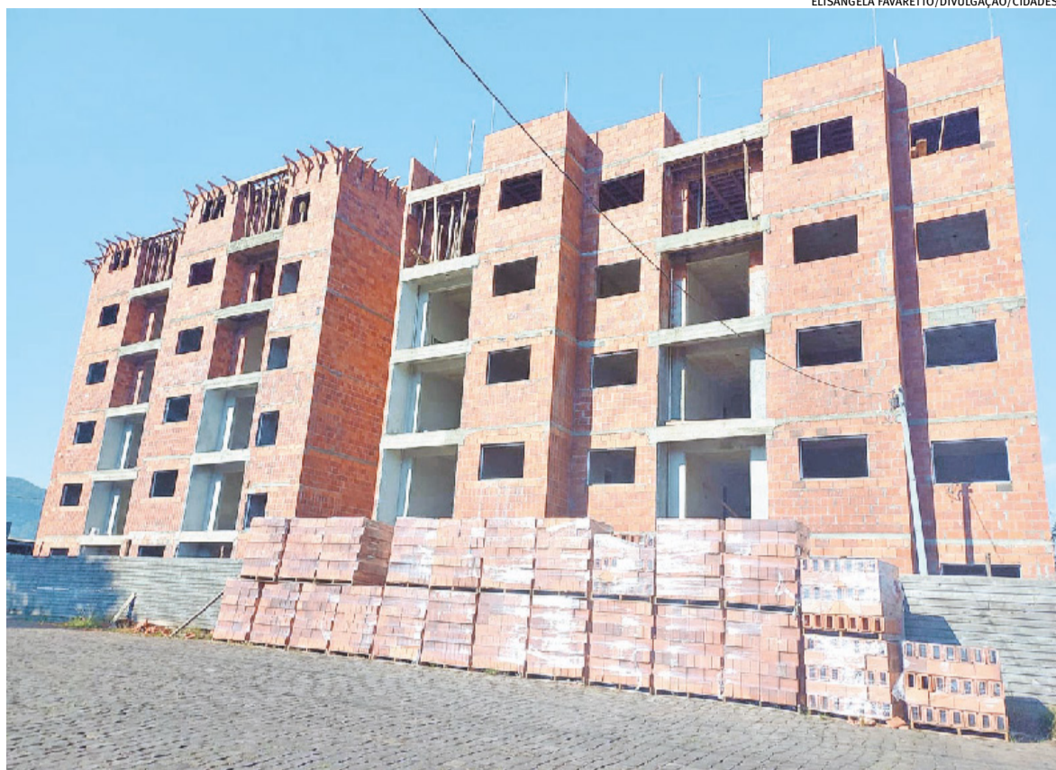
Além de áreas longe do rio, construções de prédios, cuja possibilidade de inundação é menor também estão em pauta nas cidades