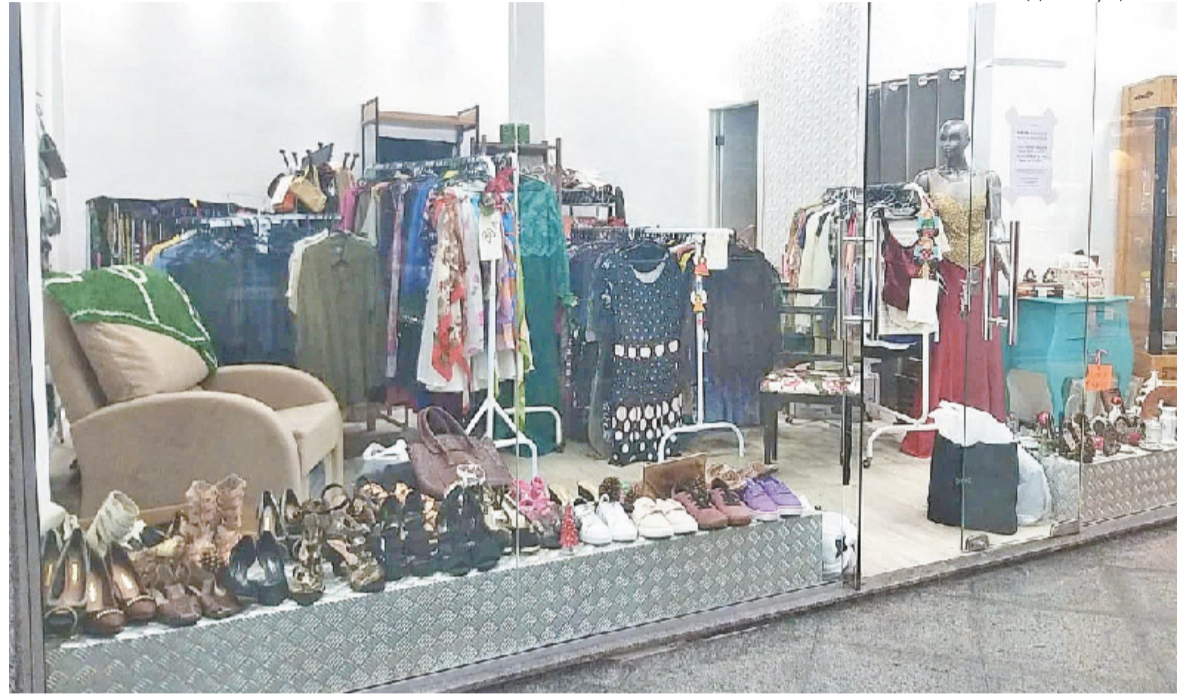
Acervo para os bazares solidários são adquiridos por meio de doações; em abril, ação arrecadou cerca de R$ 15 mil para reforma