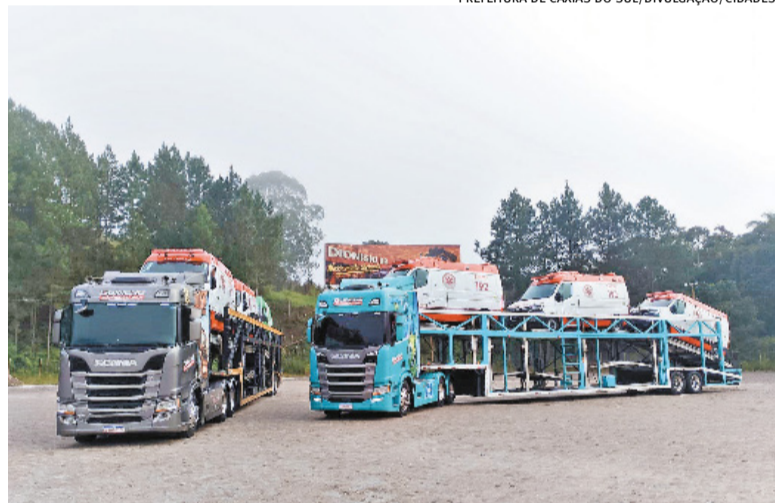
Carreta está fazendo o transporte dos veículos de Sorocaba até a Serra Gaúcha