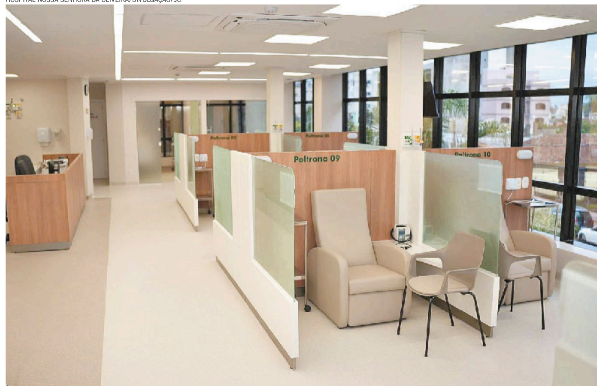
Na obra de 572 metros quadrados, executada ao longo de dois anos, foram investidos R$ 2,3 milhões