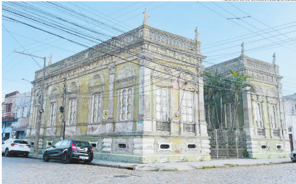
Local está fechado desde 2011 por conta de problemas estruturais; empresa será contratada para trabalhar no projeto de reforma