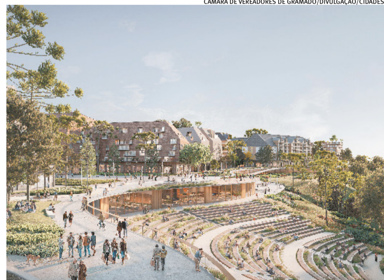
Intenção é ter uma nova área de desenvolvimento urbano na região do Mato Queimado