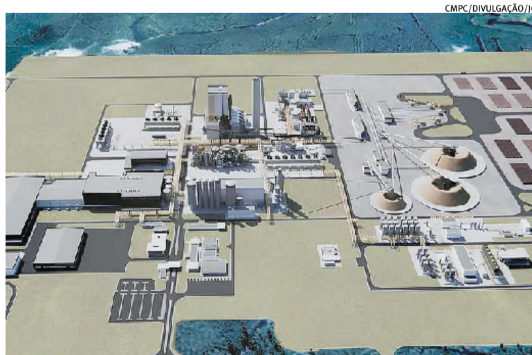
Nova fábrica de celulose implicará investimento de cerca de R$ 27 bilhões

No dia 22 de abril, a Fundação Estadual de Proteção Ambiental (Fepam) pediu ao Ministério Público Federal (MPF) a prorrogação, por mais 15 dias, para responder sobre a recomendação feita por essa instituição quanto à suspensão do processo de licenciamento ambiental do Projeto Natureza da empresa de celulose CMPC. Porém, embora esse prazo termine nesta semana, a assessoria da Fepam informou que o órgão ambiental não precisará responder ao questionamento, pois, nesse meio tempo, o Conselho Nacional do Ministério Público (CNMP) concedeu uma liminar que interrompeu os efeitos da sugestão do MPF.