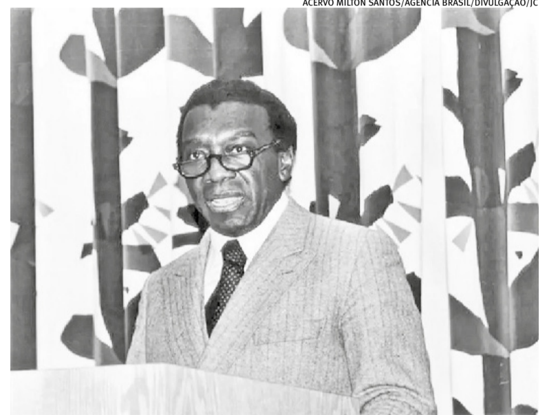
Milton Santos foi professor em universidades no Brasil e no exterior

“Ele propõe uma leitura sobre o território brasileiro, trazendo ferramentas para que a gente