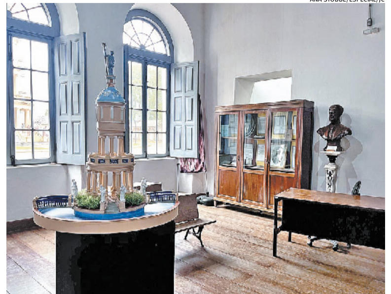
Local abrigou tribunal do júri antes de ser transformado em museu

No século XX essa atividade se consolidaria, a transformando em um dos principais centros de rizicultura do Estado, junto à região de Pelotas. Foi em 1912 que iniciou um processo maior de industrialização, com a implementação de engenhos de beneficiamento de