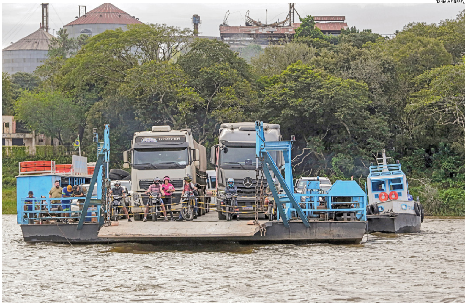
Principal acesso ao município de Cachoeira do Sul está interrompido por obras na Ponte do Fandango; travessia do rio Jacuí é feita por balsa

Obras de infraestrutura são decisivas para o desenvolvimento econômico dessa parte do Estado Caderno Especial Mapa Econômico do RS