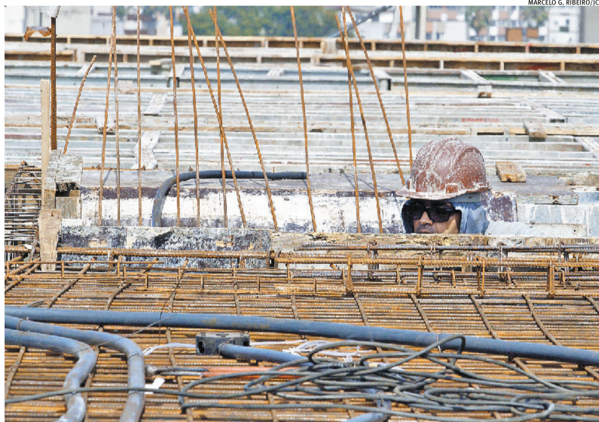
Incorporadoras sentem efeitos do aumento do valor de matérias-primas essenciais no dia a dia das obras