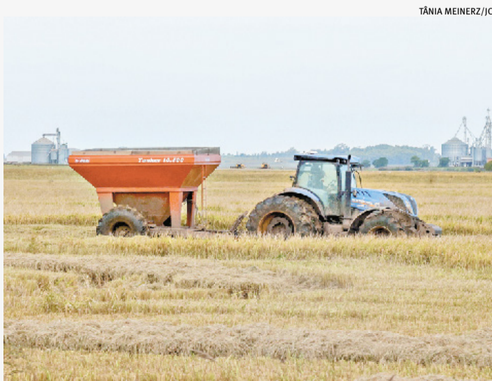
Volumes expressivos produzidos no RS ficaram fora do leilão

O leilão de Prêmio Equalizador Pago ao Produtor (Pepr) realizado ontem comercializou 103,4 mil toneladas de arroz. O volume representa 29% da oferta inicial, de 350,7 mil toneladas. Parte significativa, no entanto, foi retirada do pregão. p. 7