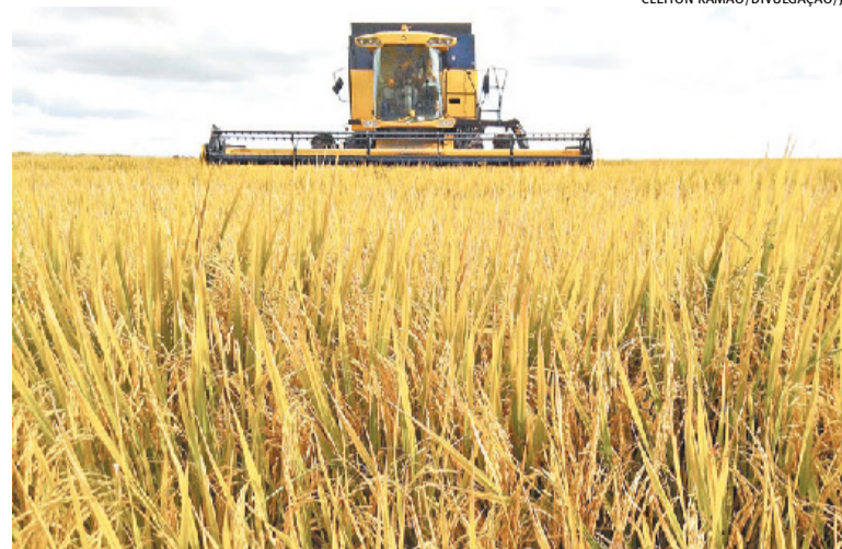
Federarroz considerou pregão positivo e destacou importância do Pepró

A competitividade também é limitada pela paridade com os preços dos Estados Unidos e pelo câmbio. “Precisaríamos de uma diferença de pelo menos US$ 5 por saca para ganhar mercados”, explica.