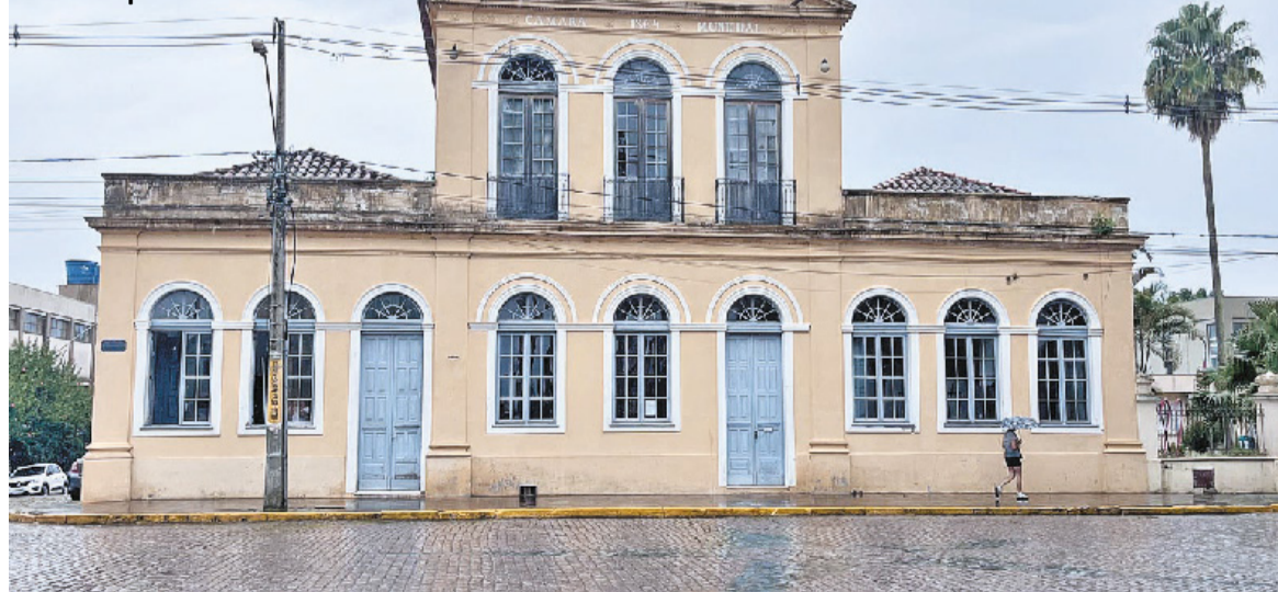
Localizado no centro de Cachoeira do Sul, prédio abrigou a primeira Câmara Municipal da cidade

Em 1975, entretanto, a estação foi desativada, com uma nova sendo construída distante da cidade, mudando os traçados da ferrovia. E os sonhos de vapor se dissiparam na sequência. Em 1996, foi extinto o transporte de passageiros. Já o de cargas seguiu, mas, com o tempo, os trilhos começaram a ser abandonados e, hoje, estão inoperantes.