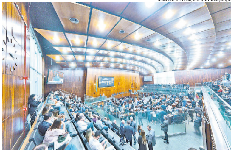
Matéria retorna para avaliação do plenário na próxima semana