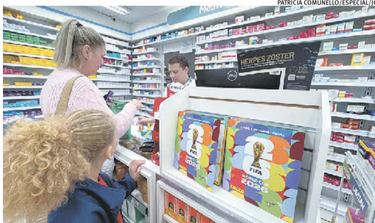
Álbum é exposto em frente ao balcão de venda de remédios

Aponte a câmera do seu celular para o QR Code e assista ao conteúdo completo