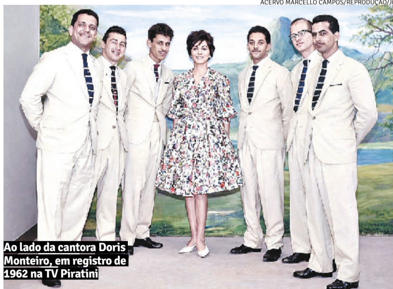
Ao lado da cantora Doris Monteiro, em registro de 1962 na TV Piratini

Após a empreitada fonográfica, uma agenda cada vez mais tomada por eventos sociais, apresentações em programas da PRH-2 ( Vespa Farroupilha , Rádio-Sequência , Os Brotos Comandam ) e ao menos cinco horas diárias de ensaio nos estúdios da emissora (então instalada em um prédio na avenida Siqueira Campos, próximo ao Mercado Público) mantinham o conjunto afiadíssimo e criativo. A fase também foi pautada pelo aprofundamento do interesse em relação ao jazz e suas diversas ramificações em voga na época, de forma impactante no amadurecimento de uma sonoridade diferenciada mas sem prejuízo ao apelo dançante dos bailes, frequentados por gente de ouvi-