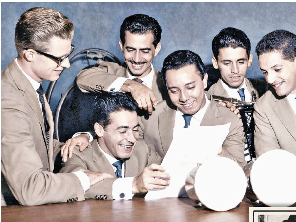
Conjunto Flamboyant em foto de 1961, ano em que rumaram ao Rio para gravar o único LP