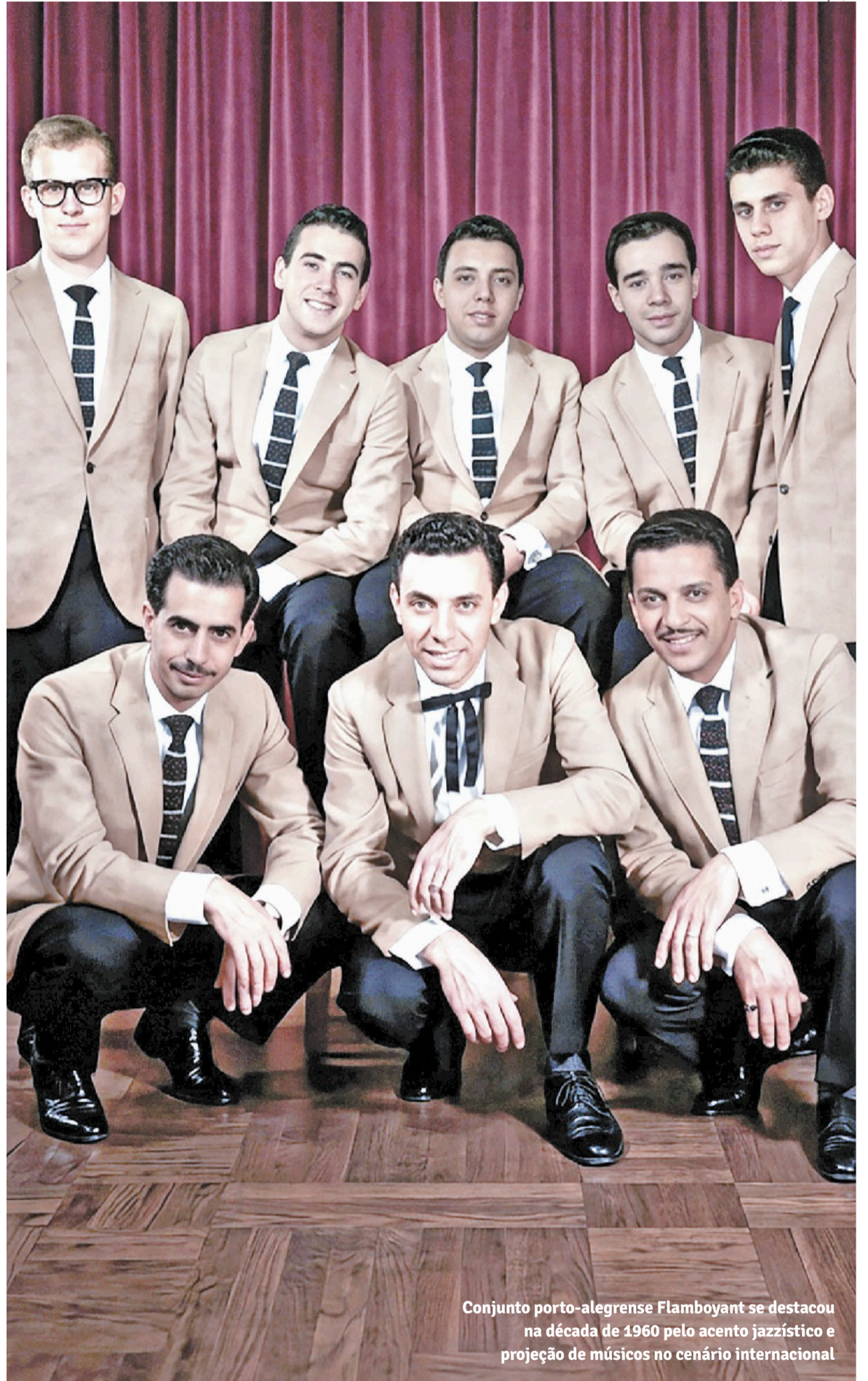
Conjunto porto-alegrense Flamboyant se destacou na década de 1960 pelo acento jazzístico e projeção de músicos no cenário internacional

“Eles discutiam o assunto em um dos bancos da Praça da Alfândega quando me aproximei, à tardinha, já conhecendo quase todos ali. Inicialmente não quis me meter, mas, ao perceber o chão repleto de folhas perto da Rua da Praia, durante o outono, sugeri na mesma hora que batizassem o grupo de ‘Flamboyant’, por causa da árvore, bela e frondosa... Eles adoraram a ideia, que acabou vingando. Mas algum tempo depois, alertado por um conhecido que entendia de botânica e tal, fiquei sabendo que, na verdade, eu tinha visto um jacarandá ou algo do tipo. Mas já era tarde para voltar atrás, porque o su-