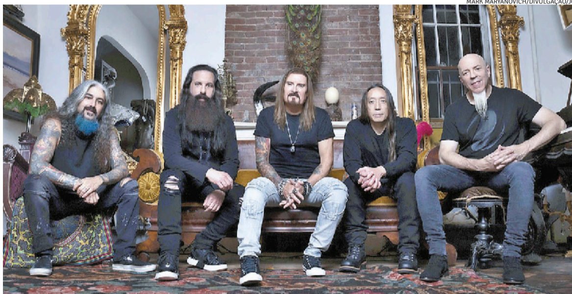
Show de domingo traz formação que gravou discos clássicos da banda, com retorno do baterista Mike Portnoy (esq)

uma abordagem conceitual sobre distúrbios do sono, e marca o retorno do lendário baterista Mike Portnoy à formação. Além dele, a banda atualmente reúne James LaBrie (voz), John Petrucci (guitarra), John Myung (baixo) e Jordan Rudess (teclados), formação que moldou alguns dos capítulos mais importantes da discografia do conjunto.