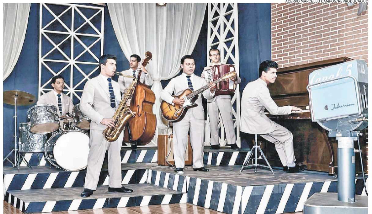
Apresentações em canais televisivos como a TV Piratini projetaram a fama do Conjunto Flamboyant por todo o Estado