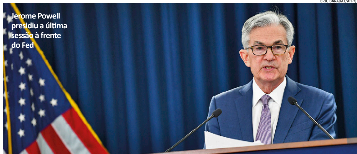
Jerome Powell presidiu a última sessão à frente do Fed

No comunicado, o FOMC afirmou que estará “preparado para ajustar a postura da política monetária conforme apropriado, caso surjam riscos que possam impedir o alcance das metas do comitê”, decisão esta que foi recusada por três dos participantes. O FOMC voltou a defender a busca pelo “pleno emprego” e pela meta da inflação de 2%.