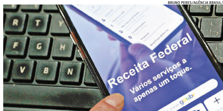
Resultado foi o maior para março desde o início da série histórica

contribuições federais até março de 2026 somou R$ 777,117 bilhões, informou a Receita. O montante representa alta de 4,58% na comparação com 2025, descontada a inflação do período. Segundo o órgão, é a maior arrecadação no primeiro trimestre desde 2000. No relatório de divulgação, o Fisco atribui o desempenho da arrecadação em 2026 à receita previdenciária, que teve uma arrecadação