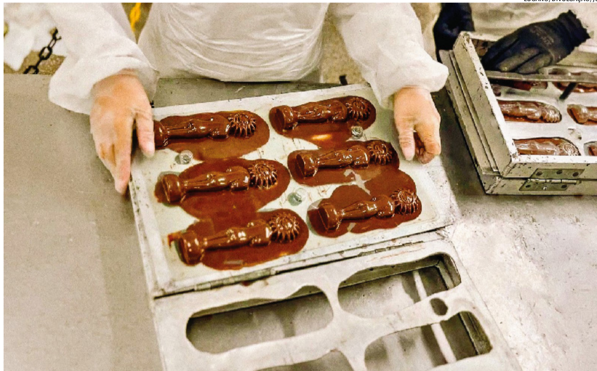
A medida visa proteger a Indicação Geográfica (IG) do chocolate artesanal local; suspensão é válida pelos próximos 180 dias