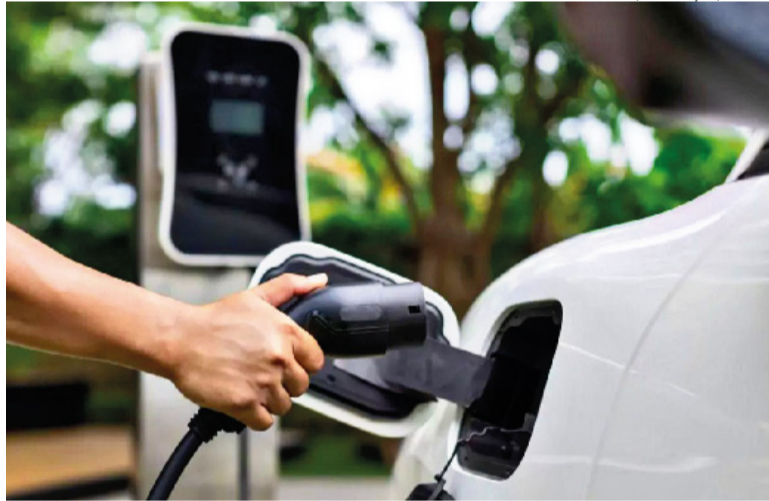
Leilão para definir as empresas interessadas no projeto ocorrerá em 27 de maio