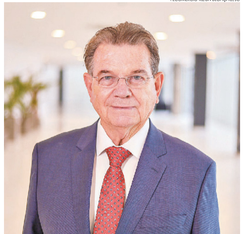
Apesar das circunstâncias, o otimismo permanece, destaca Bohn

Quanto às expectativas, 47,8% esperam alguma melhoria e 19,2% ainda esperam piora do cenário. “Apesar das circunstâncias atuais de desaceleração econômica e juros elevados, os atacadistas permanecem otimistas”, comentou o presidente da