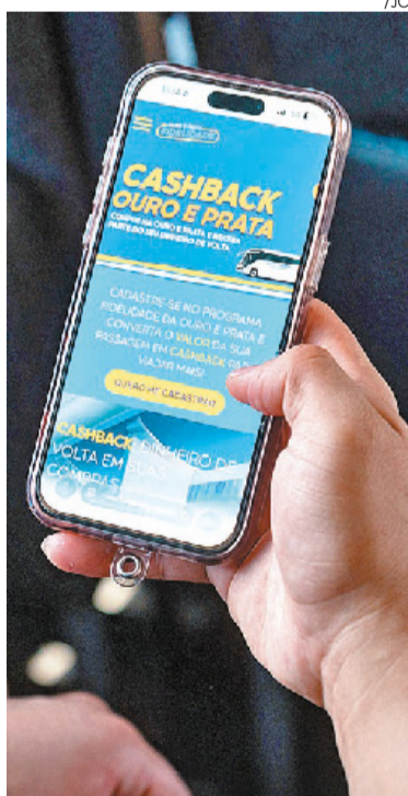
Iniciativa da Viação Ouro e Prata substitui o Programa Fidelidade

A Viação Ouro e Prata lançou, no começo de abril, o Programa de Cashback Ouro e Prata, que transforma parte do valor pago nas passagens de ônibus em saldo acumulado. Esse crédito poderá ser utilizado como desconto na compra de futuras passagens, incentivando a recorrência e fortalecendo o vínculo com a marca.