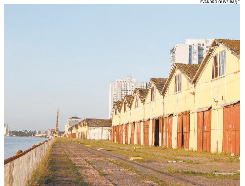
Leilão foi realizado em fevereiro de 2024 e prevê concessão de 30 anos

concessão, o Cais Embarcadero é fruto de um acordo firmado entre um grupo de empresários com o consórcio Cais Mauá do Brasil, que venceu o leilão da área em 2010, mas cujo contrato foi rompido pelo Piratini em 2019. Então o governo, já sob comando de Eduardo Leite, acolheu o projeto, sem submeter a ocupação da área à concorrência pública.