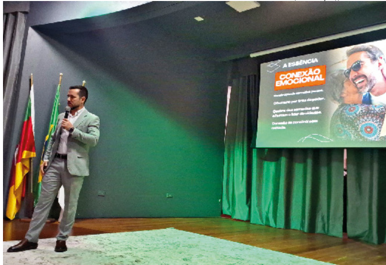
Evento também contou com palestra sobre o uso da inteligência artificial na política