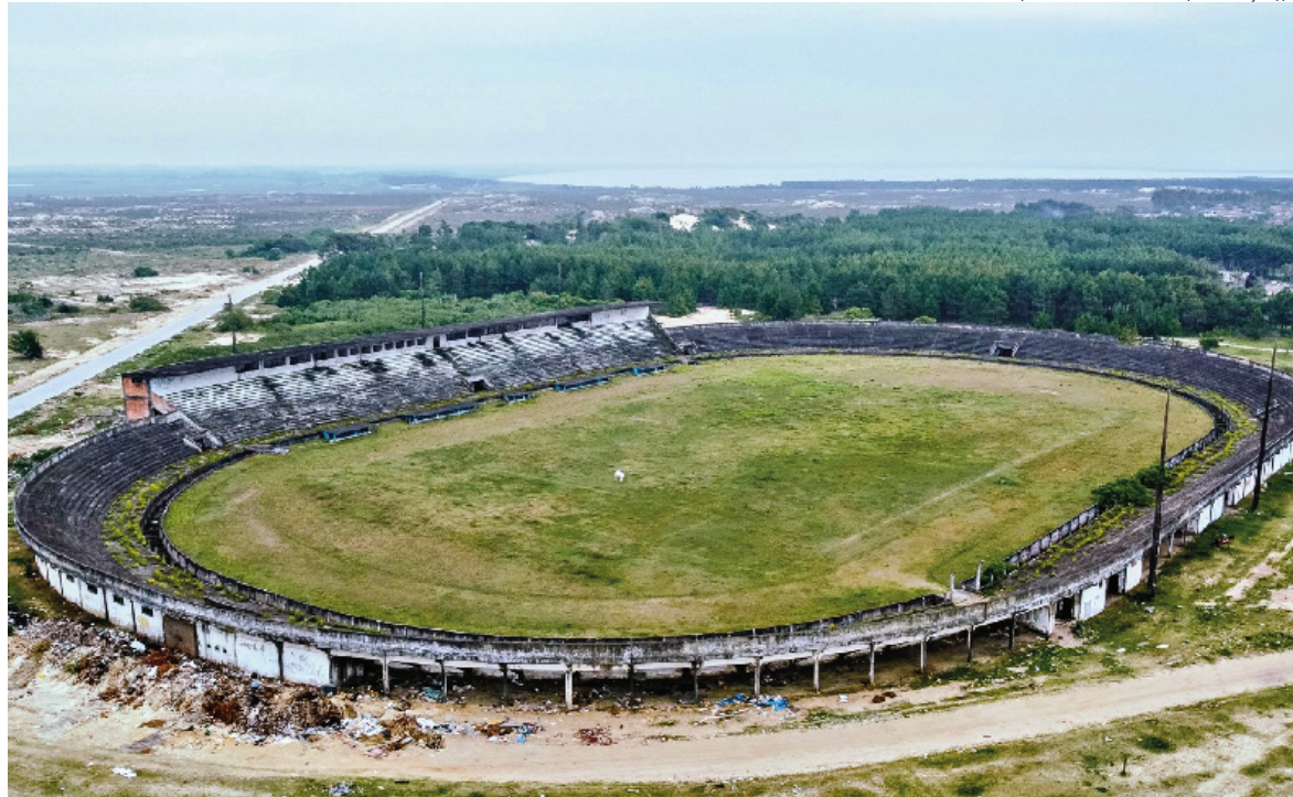
O estádio está interditado desde 2010 a pedido do MPRS, até que sejam realizadas as obras de recuperação necessárias