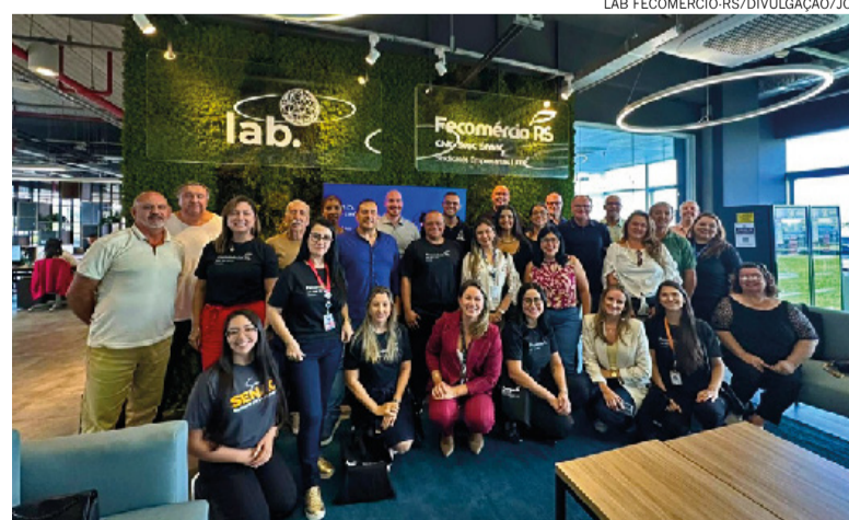
Grupo de Santana do Livramento fez imersão para conhecer espaço