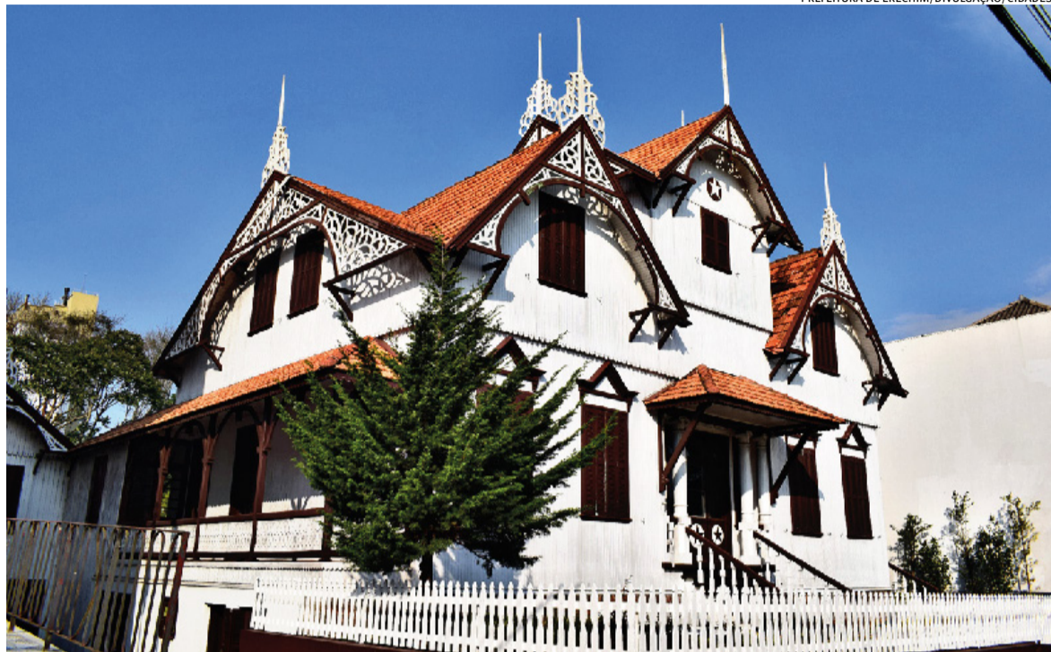
Prédio de madeira, construído na década de 1910, foi tombado pelo Iphae em 1982 e deve receber R$ 6,6 milhões em obras