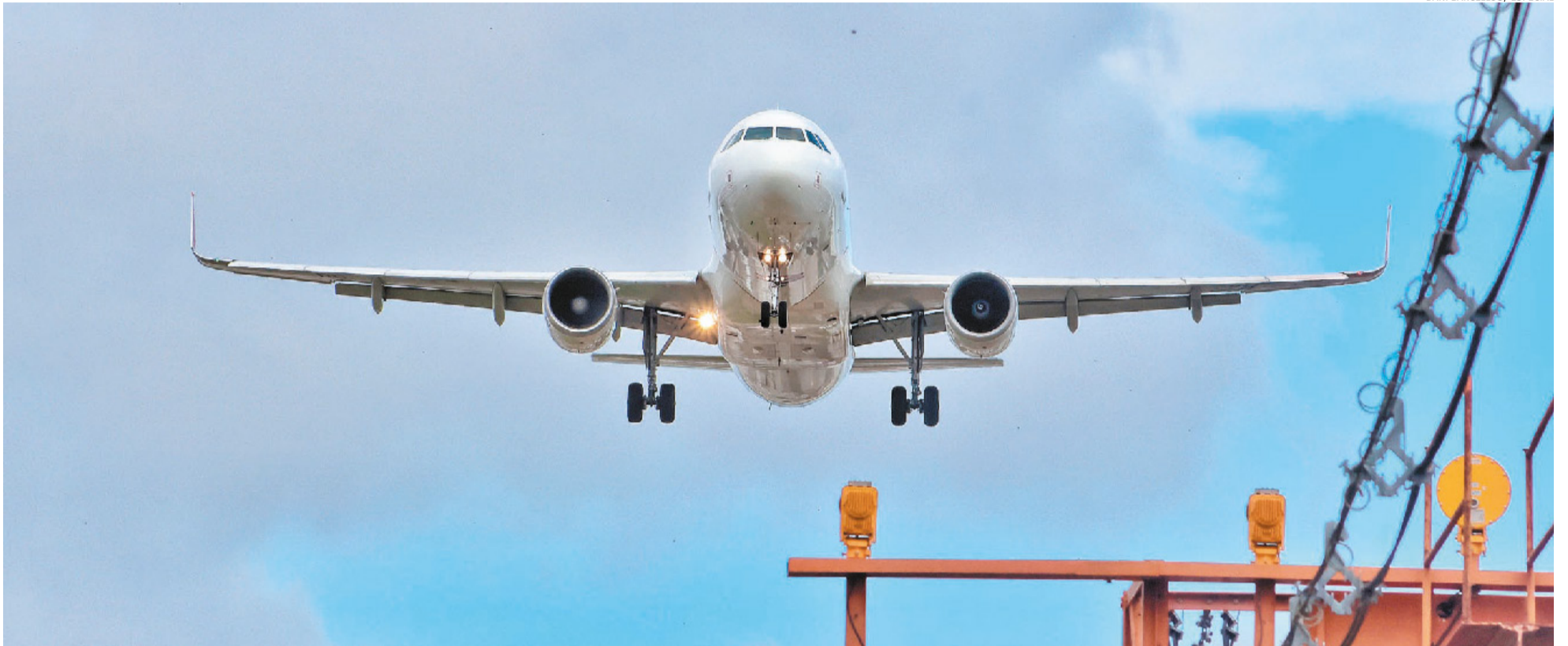
Administração do Aeroporto Internacional Salgado Filho, em Porto Alegre, confirmou que as operações seguem a normalidade