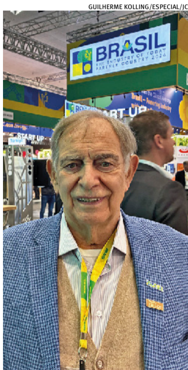
Presidente do Sistema Fiergs vê boas condições de competitividade