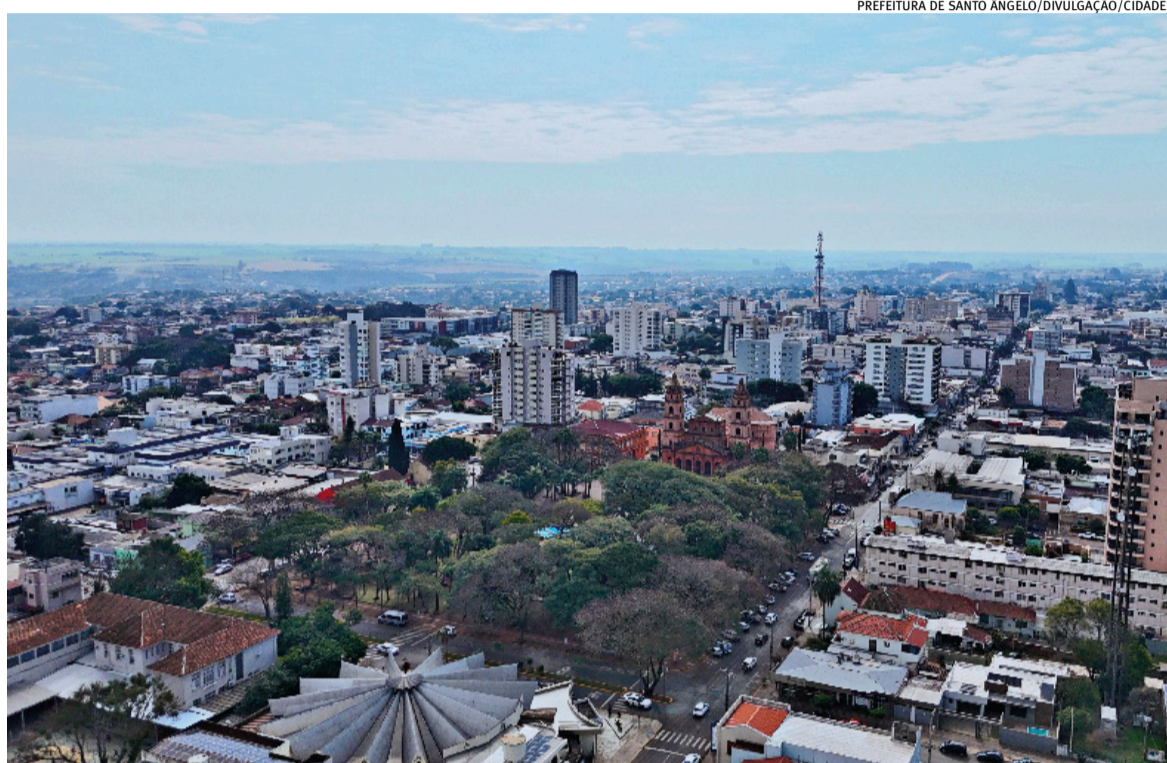
Aumento da ocupação hoteleira e novos investimentos podem alterar perfil econômico de Santo Ângelo e São Miguel das Missões

Um dos indicadores é o espetáculo Som e Luz, no Sítio Arqueológico de São Miguel Arcanjo, vem registrando um aumento de cerca de 70% no público. Em quatro meses, a arrecadação já supera metade do total registrado em todo o ano anterior. "Já percebemos esse aumento também no PIB do turismo", pontua a secretária.