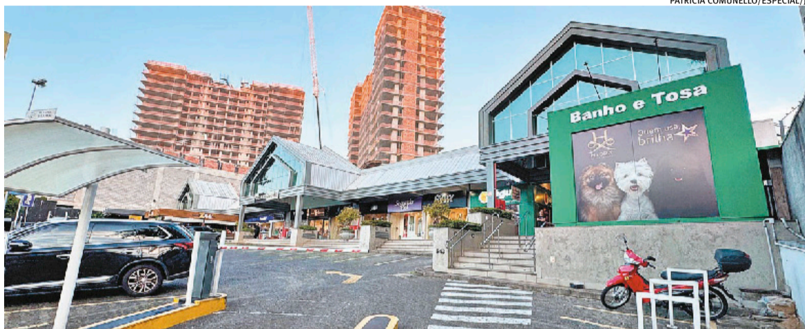
Empreendimento tem 14 lojas e fica ao lado de futuro complexo do Grupo Zaffari com Melnick

Há operações com mais de 20 anos no endereço. No comunicado, seguindo a Lei do Inquilinato (8.245, de 1991), que obriga a ofer-