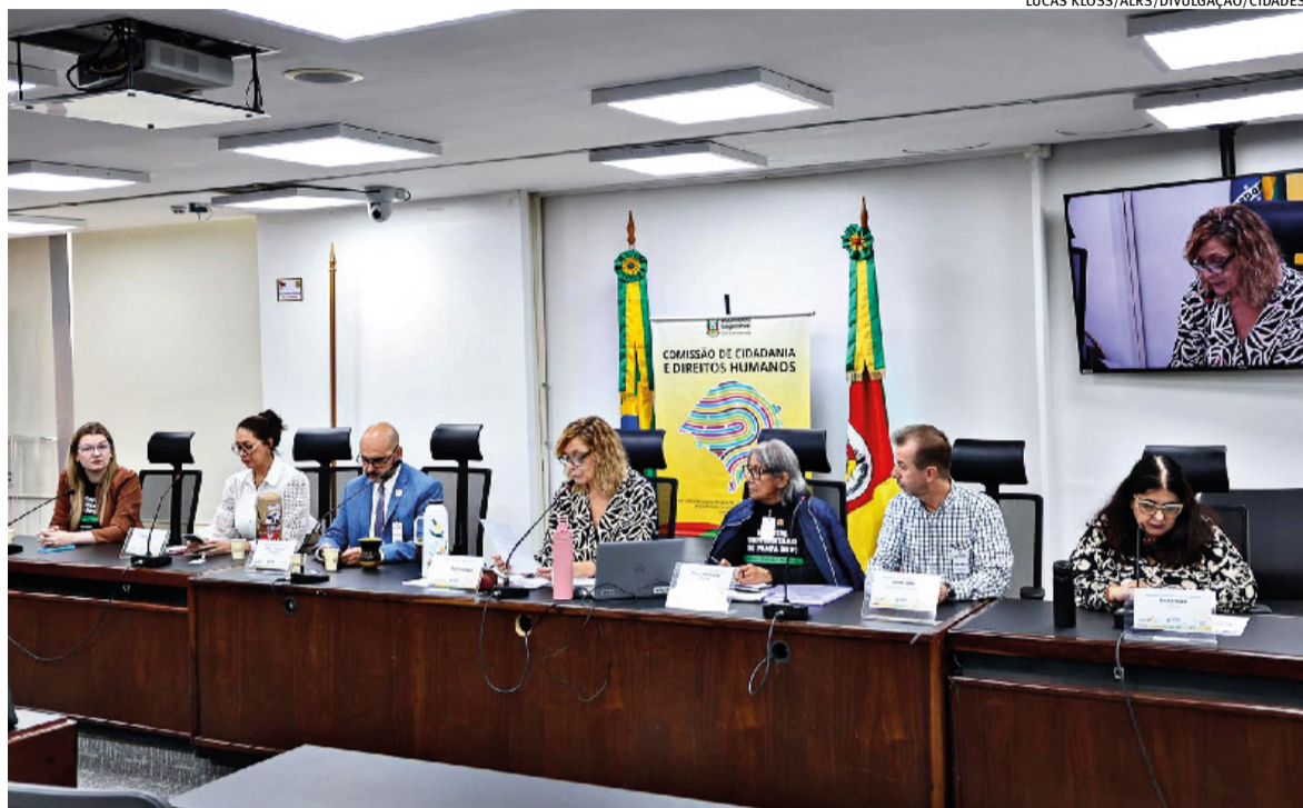
Lideranças regionais querem ter a garantia dos recursos para a realização da obra, aprovada pelo governo federal em 2025

A urgência para atendimentos de média e alta complexidade na Fronteira Oeste é o vetor para agilizar as demandas relacionadas à viabilização do Hospital Universitário do Pampa, que esteve em debate na audiência pública desta quarta-feira (22) da Comissão de Cidadania e Direitos Humanos da Assembleia Legislativa. No Campus da Unipampa, os prédios abrigarão as unidades de cardiologia, pediatria, gastrologia, saúde mental, neurologia, traumatologia, ortopedia e materno infantil com a previsão inicial de 180 leitos para a região. Para isso, a reitoria da Unipampa articula a garantia de recursos orçamentários estadual e federal para o início das obras no próximo ano.