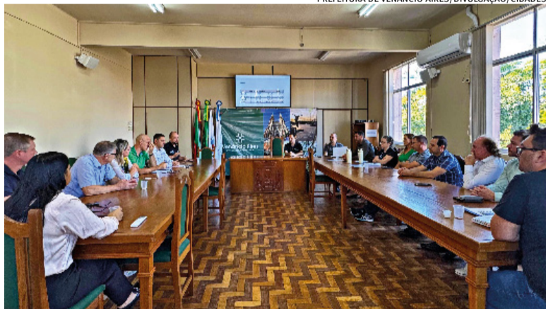
Objetivo é recompor parte do déficit de R$ 753 mil por mês que a instituição possui