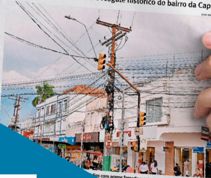
Edifícios com arame farpado e estruturas de proteção instaladas

A forma como os crimes ocorrem também influenciou diretamente as medidas adotadas pelos comerciantes. Muitas vezes, o anti-