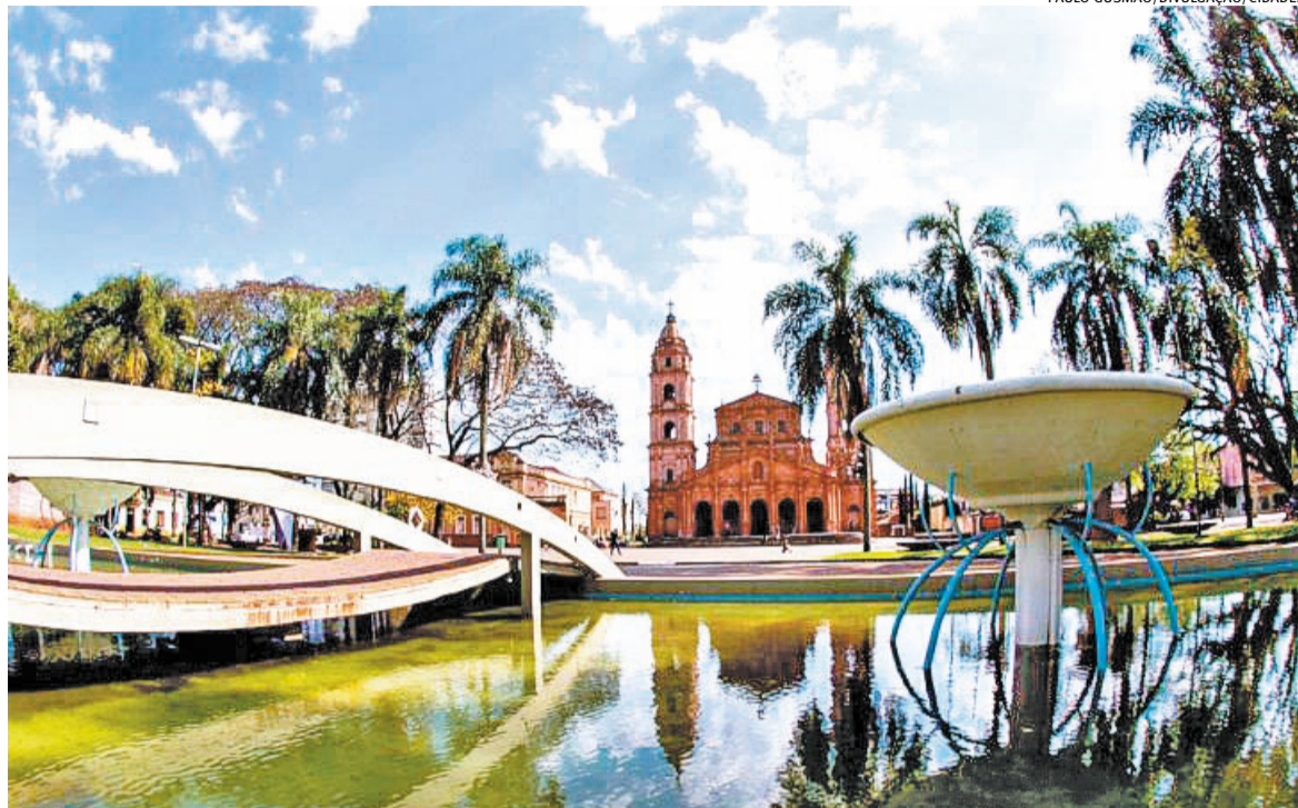
Semana Missioneira traz atrações artísticas e educativas sobre a história dos povos originários em diversos municípios

O governo do Estado, por meio da Secretaria da Cultura (Sedac), realiza até 25 de abril a Semana Missioneira, com programação gratuita em diversos municípios da região. A iniciativa integra, neste ano, as celebrações dos 400 anos das Missões Jesuíticas Guarani.