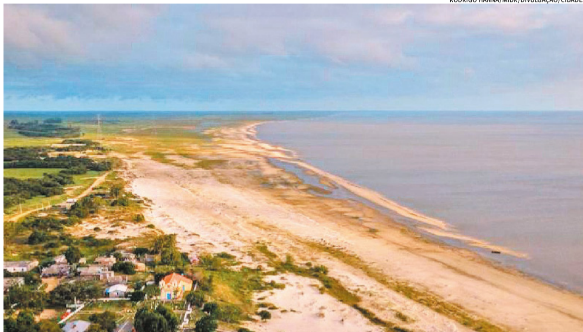
Lagoa tem papel estratégico para a região Sul, especialmente para a irrigação, a pesca artesanal e o abastecimento de água

A gestão compartilhada das águas entre Brasil e Uruguai deu mais um passo concreto com o avanço do diagnóstico da bacia da Lagoa Mirim, base para ações conjuntas de preservação e uso sustentável. Representantes do Ministério da Integração e do Desenvolvimento Regional (MI-DR) participaram, no fim da semana passada, da Oficina Binacional do Projeto Lagoa Mirim, realizada em Pelotas, que discutiu a versão preliminar da Análise Diagnóstica Transfronteiriça (ADT), etapa fundamental para a construção do Plano de Ação Estratégica (PAE).