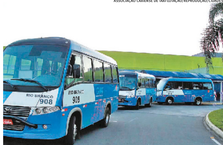
Desde sua implantação na década de 1990, número de veículos caiu de 22 para seis