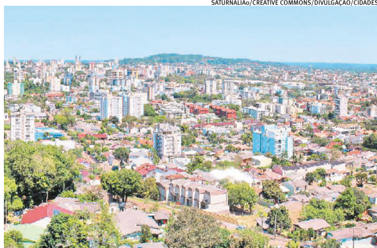
Disponibilidade de recursos representa impacto positivo no Vale do Rio Pardo

Somados, os três municípios concentram mais de R$ 95,6 milhões considerando o total da antecipação do 13º salário, distribuído em duas parcelas, entre o fim do mês de abril e o início do mês de junho, ampliando o impacto regional da medida ao longo desse período. Considerando os demais municípios da base operacional do Sindilojas-VRP, Mato Leitão, Herveiras, Gramado Xavier, Vale do Sol e Sinimbu, para os quais não se tem acesso à estimativa de valores, o montante que deve ingressar na economia durante o período ultrapassa os R$ 100 milhões.