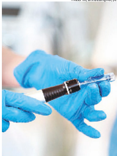
Medicamentos não passaram por avaliação da agência reguladora