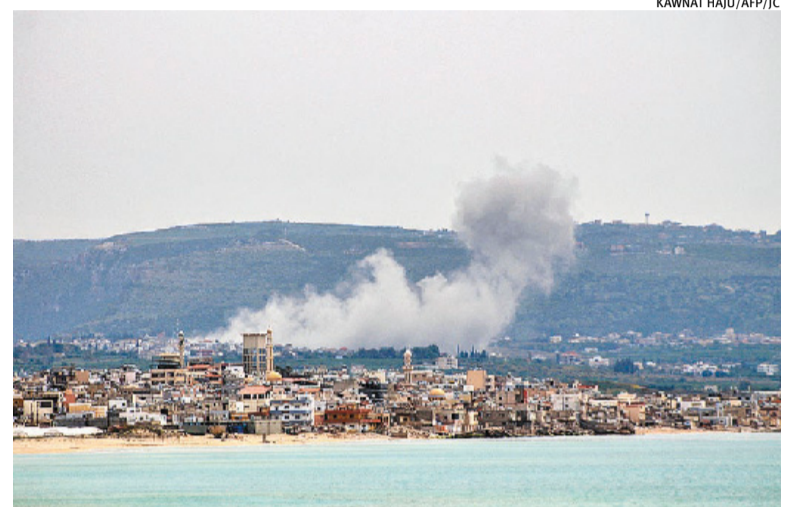
Combates continuaram ontem, com registro de ao menos nove mortes

Os combates cessaram na semana passada, mas o prazo dado por Donald Trump para um acordo acaba na próxima terça. O Irã recebeu uma delegação liderada por