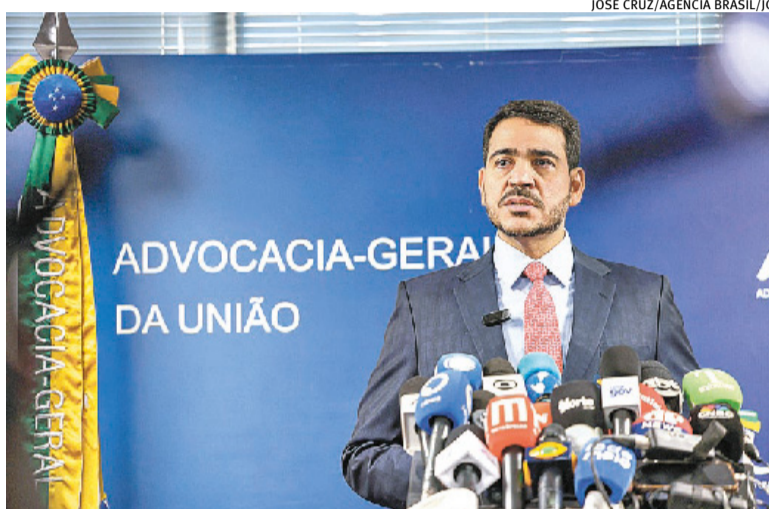
Jorge Messias é o atual titular da Advocacia-Geral da União

Ao ler o parecer, o relator Weverton Rocha destacou a atuação de Messias na AGU foi marcada