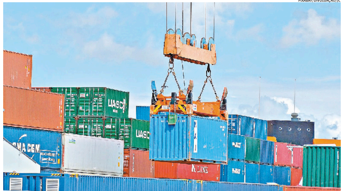
Queda foi puxada pelo desempenho negativo de nove dos 23 segmentos industriais analisados

lhões frente ao mesmo período de 2025, o equivalente a uma queda de 5,1%. No primeiro trimestre, a maior parte das compras gaúchas foi de produtos classificados como pertencentes ao ramo de Automóveis.