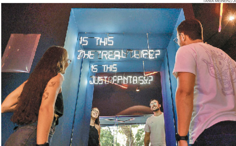
O espaço também conta com salas privativas pensadas para grupos

O Sofia Karaoke funciona de terça a domingo, a partir das 18h. A casa fica na rua Comendador Caminha, nº 348, no Moinhos de Vento. Para mais informações, acesse sofiakaraoke.leadfood.app