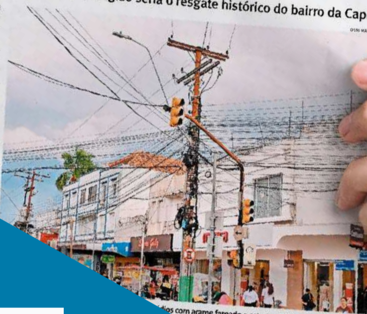
Edifícios com arame farpado e estruturas de proteção instaladas

A forma como os crimes ocorrem também influenciou diretamente as medidas adotadas pelos comerciantes. Muitas ações anti-