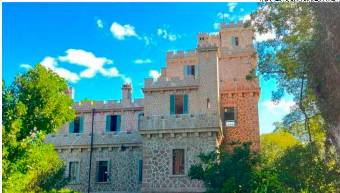
Restauração e melhorias na edificação histórica da região Sul, datada de 1913, foram realizadas via Lei de Incentivo à Cultura

Referencial histórico e arquitetônico do Rio Grande do Sul, o Castelo da Granja Pedras Altas, localizado no município homônimo, na região sul do Estado, passou por uma nova etapa de obras, entregues na sexta-feira (10). A quarta fase dos trabalhos contou com investimento de R$ 2.051.310,03, divididos entre R$ 1.971.310,03, captados via Lei de Incentivo à Cultura (LIC), e R$ 80 mil provenientes do município.