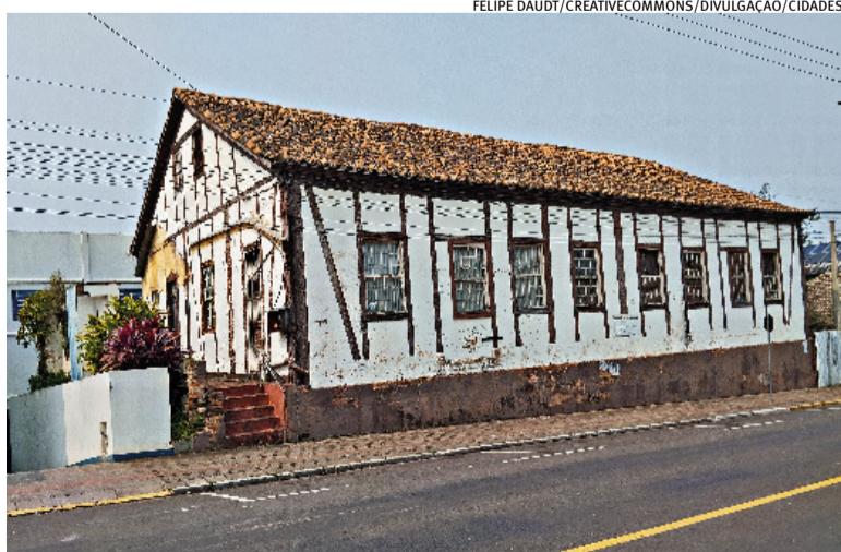
Salão Holler é considerada a maior construção do Estado com a técnica enxaimel