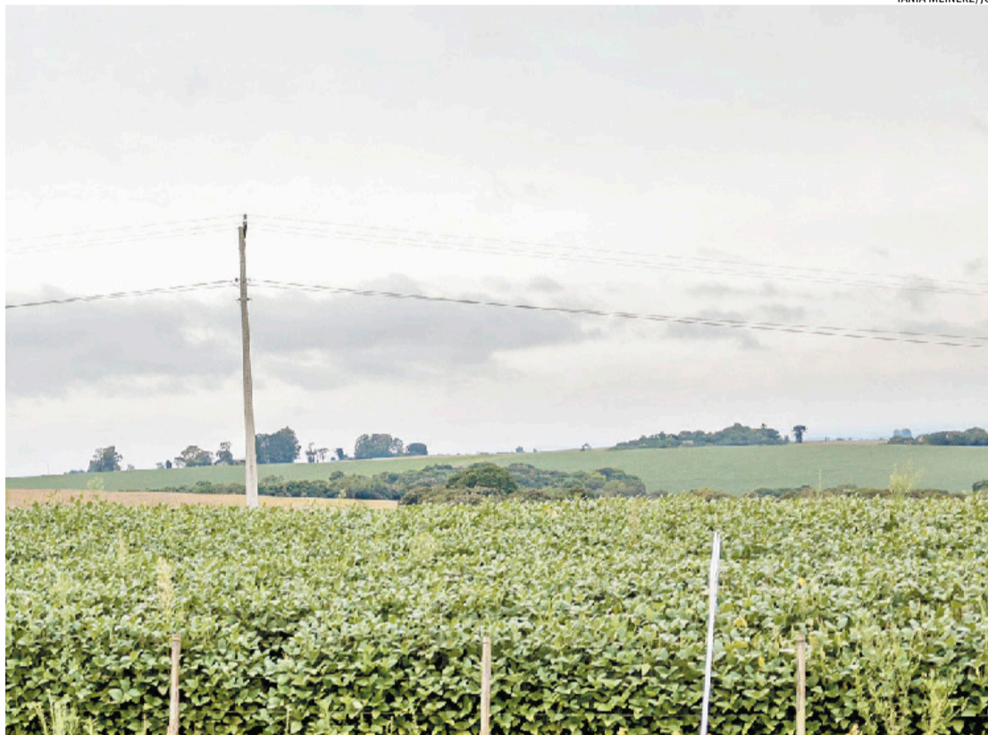
Alto Jacuí, com municípios como Não-Me-Toque (foto), é o Corede com o maior PIB per capita do RS