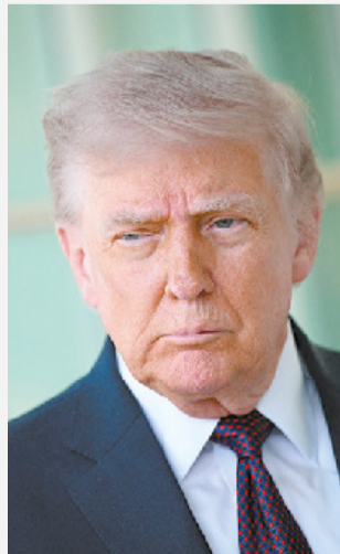
Entrevista de Trump voltou a movimentar mercados