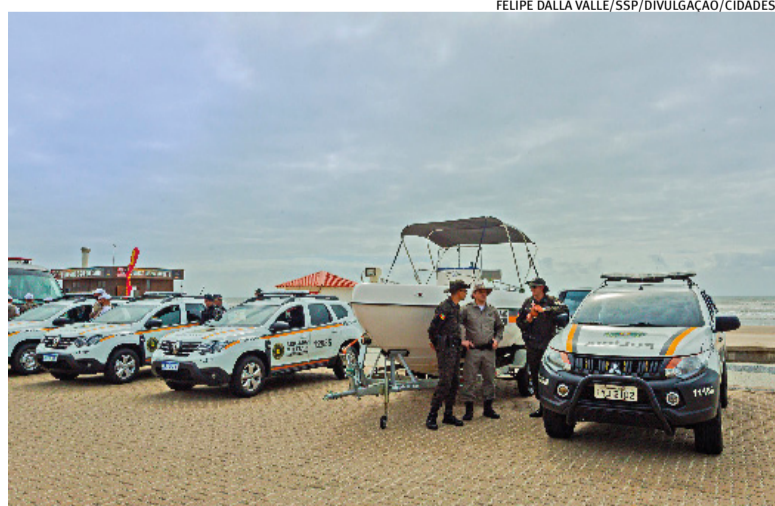
Chegada de novos veículos para a BM ajudou a para reforçar ações na região

Durante a Operação Verão Total 2025/2026, realizada entre dezembro e março, houve redução de 51% nos crimes violentos letais intencionais, de 44% nos roubos a pedestres e de 11% nos roubos de veículos em comparação com o mesmo período do verão anterior. A ação mobilizou cerca de 3,3 mil servidores de diferentes órgãos estaduais para atuação conjunta em municípios do litoral.