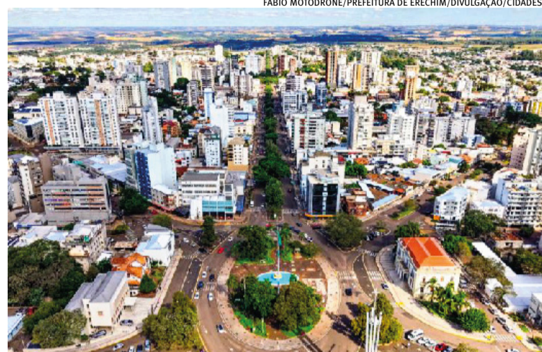
Trabalhos visam melhorias nas avenidas Sete de Setembro e Maurício Cardoso

Durante a execução dos reparos, algumas quadras e vias deverão ser parcialmente interditadas para garantir a seguran-