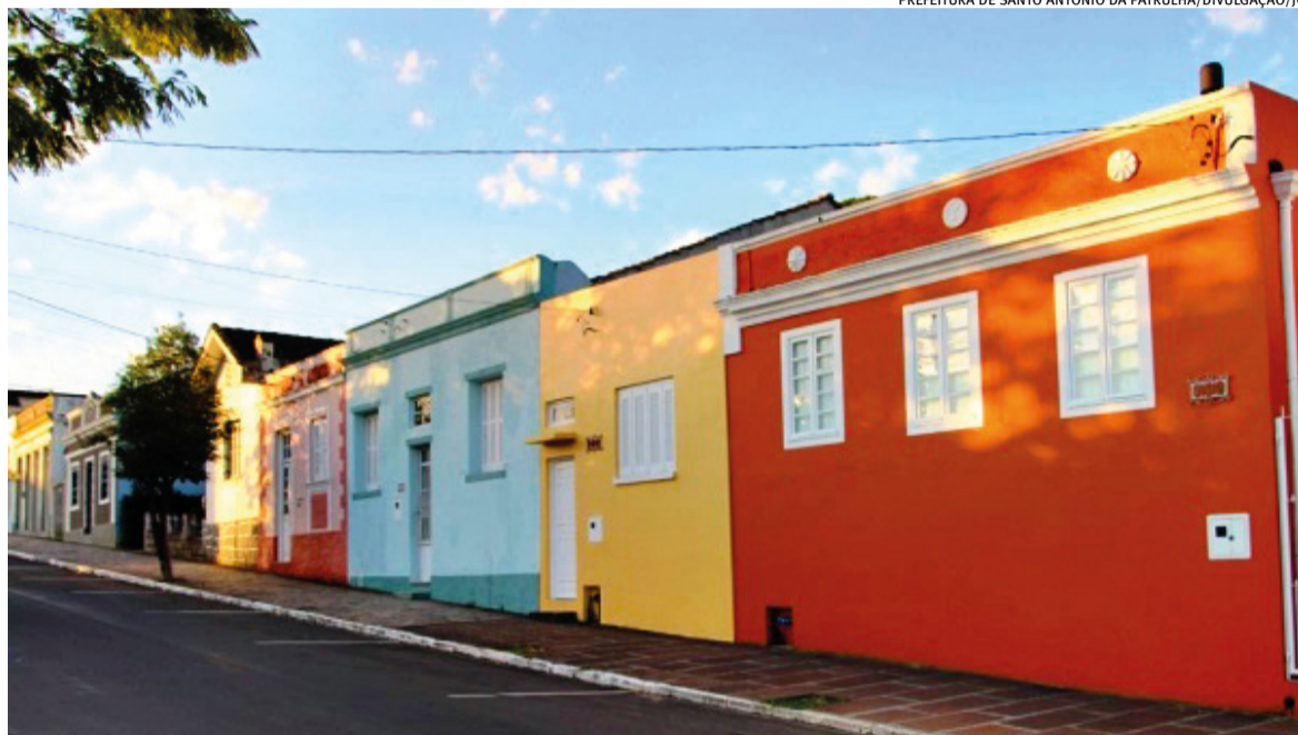
Imigração portuguesa imprimiu sua influência na arquitetura típica do município e inspira homenagem às origens da cidade