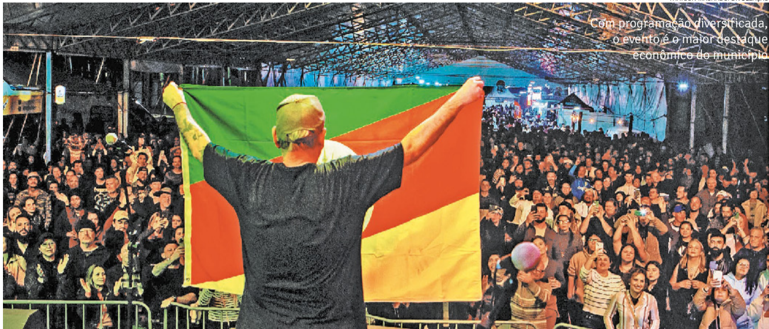
Com programação diversificada, o evento é o maior destaque econômico do município