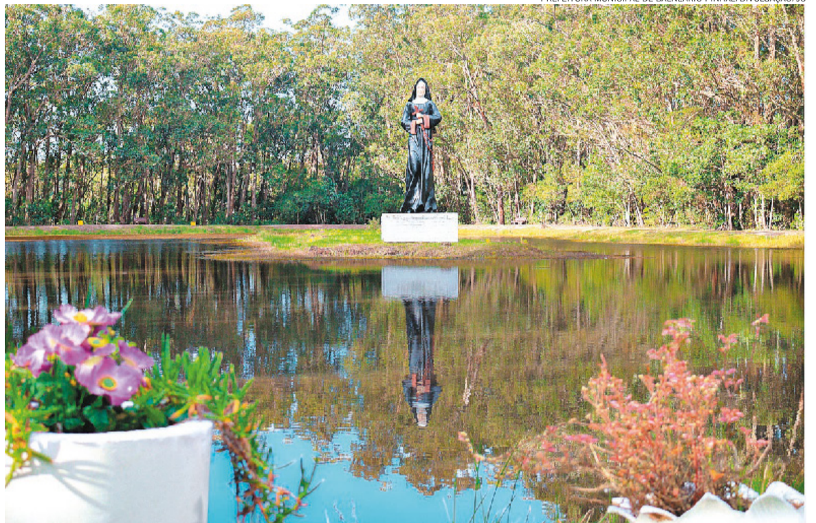
Santuário de Santa Rita, em Balneário Pinhal, é considerado patrimônio histórico-cultural do Estado

Eventos não religiosos na sua essência que incluem shows também vêm se beneficiando desse tipo de interesse espiritual, de forma indireta. Nas programações, lá estão nomes de cantores com te-