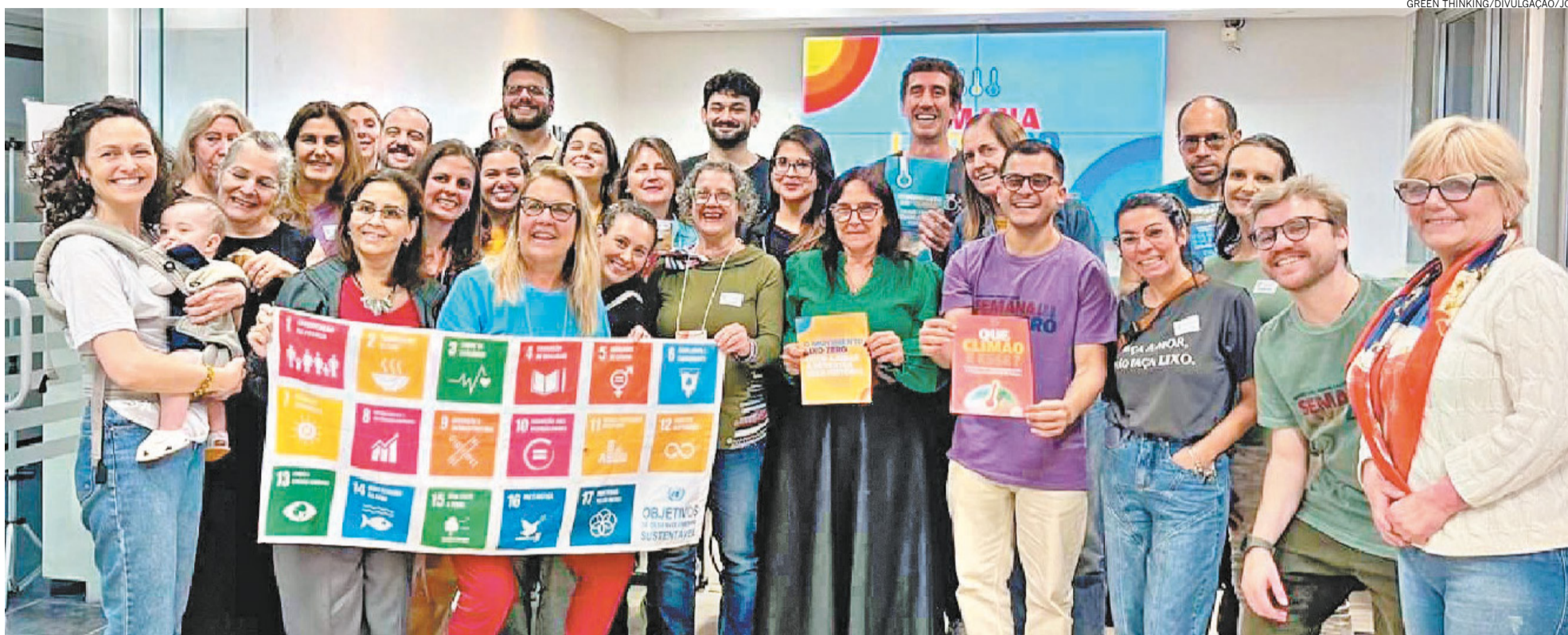
Ao integrar educação, tecnologia e práticas sustentáveis, a organização está reconfigurando o cenário socioambiental no Rio Grande do Sul e estimulando novas práticas