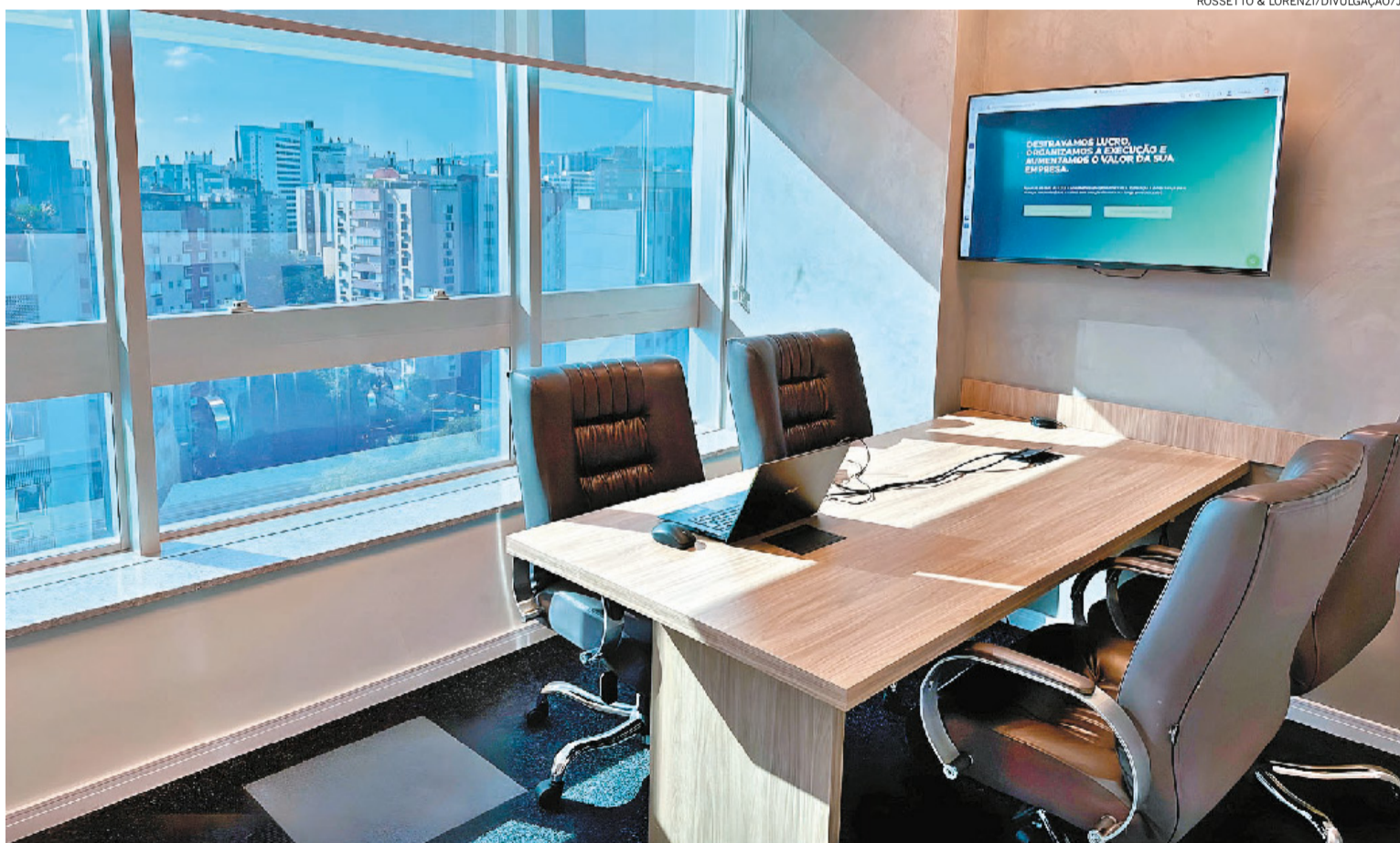
Atendimentos se concentram em empresas em reestruturação financeira, em fase de crescimento acelerado e nas já consolidadas, mas com baixa rentabilidade