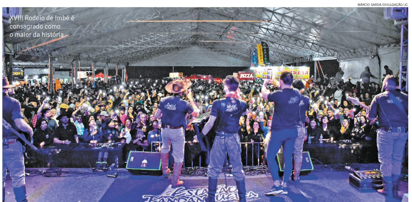
XVIII Rodeio de Imbé é consagrado como o maior da história

Um dos mais concorridos é o Rodeio Crioulo de Xangri-Lá, cuja 13ª edição foi realizada de 25 a 29 de março e distribuiu R$ 220 mil em prêmios na Campeira com recorde de público, conforme a organização. A Cam-