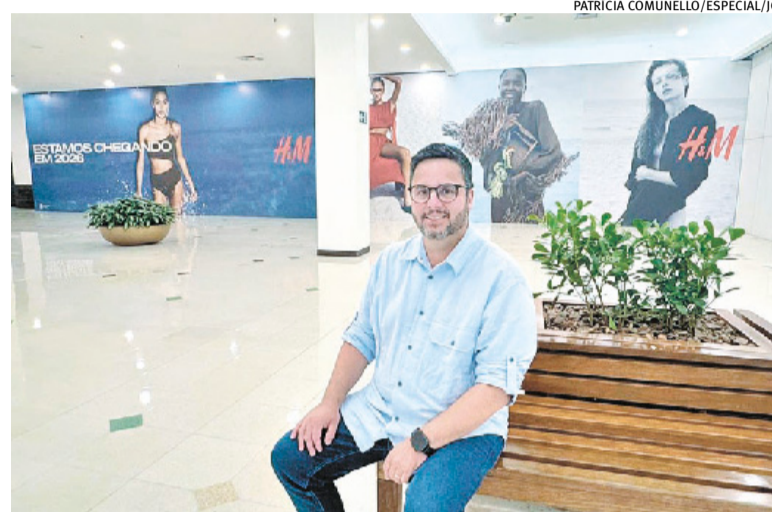
Rassier espera mais fluxo no Praia de Belas; abertura é em 28 de maio

masculinos e infantis. Em outros mercados, como nos Estados Unidos, a H&M também tem segmentos de casa e decoração. Vão ser abertos 200 empregos com as novas operações. A filial do Iguatemi POA terá cerca de 1,8 mil metros quadrados e a do Praia de Belas, 1,9 mil metros