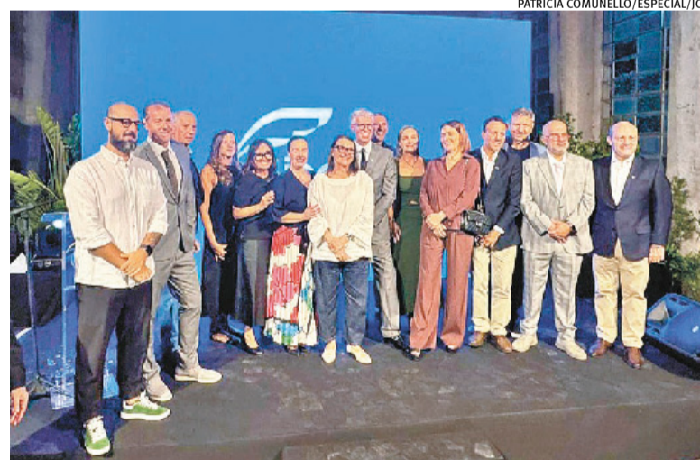
Dirigentes de bares e restaurantes na posse no complexo do Caldeira