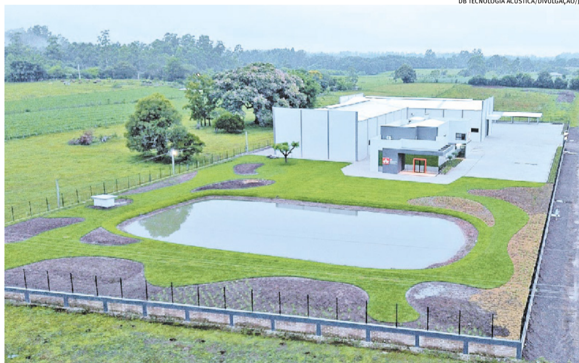
Novo prédio abriga estrutura industrial e administrativa e foi inaugurado no dia 3 de março

Na planta, são produzidos todos os equipamentos, desde o projeto inicial até a montagem – com exceção dos alto-falantes, que são desenvolvidos pela empresa, mas cuja fabricação é terceirizada. Futuramente, é possível que, mesmo essa atividade, seja realizada pela própria marca. Os projetos são, em sua maio-