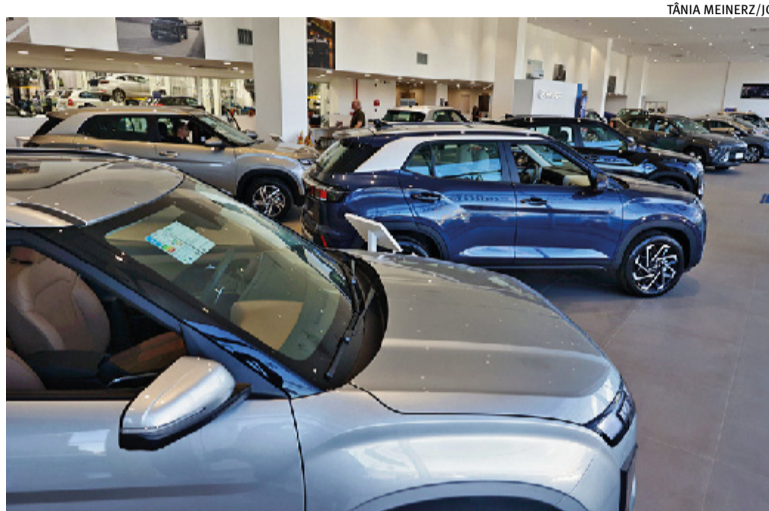
No Brasil, houve um aumento de 16,09% no comércio de veículos novos

Ao todo, foram comercializados 42.106 veículos, o que representa uma queda de 2,17% ante o mesmo recorte do ano passado. A grande discrepância foi na comparação com o acumulado nacional,