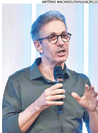
Para Zema, o País precisa fazer mudanças na condução do Estado

O pré-candidato criticou a percepção sobre o papel do empresá-