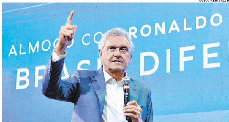
Pré-candidato do PSD afirmou a empresários que ‘é hora da mudança’

Caiado defende a anistia geral como forma de pacificar o Brasil e resgatar a credibilidade das instituições democráticas. “A anistia geral é a maneira de pacificar o cenário político nacional”, afirmou.