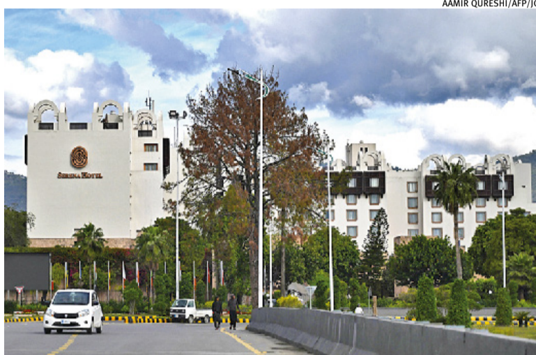
Negociações de cessar-fogo iniciam sábado no hotel Serena, em Islamabad

Por décadas, o Paquistão era um aliado vital dos EUA no Sul da Ásia. Foi de lá que as armas que apoiaram os mujahedin afegãos contra a ocupação soviética (1979-