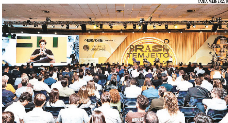
Painel reuniu executivos de XP, Nelogica e Instituto B55 nesta quinta

A mudança de papel ao longo da jornada foi tratada como um dos momentos mais críticos. No início, o empreendedor concentra funções - vende, opera, desenvolve produto -, mas, com o crescimento, precisa migrar para uma