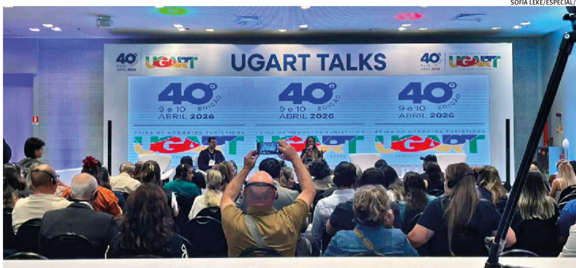
Promovido pela União Gaúcha de Operadores e Representantes de Turismo, evento ocorre até esta sexta-feira

cha de Operadores e Representantes de Turismo (Ugart), uma associação sem fins lucrativos que reúne profissionais e empresas do turismo do Rio Grande para fortalecer e representar o setor no Estado, a feira foca exclusivamente em negócios turísticos e não é aberta ao público, mas conta com um grande volume de visitantes na edição. Em 2025, a associação registrou 6,3 mil participantes, os quais ultrapassaram em 38% a edição do ano anterior, além da estimativa de R$ 10 milhões em empreendimentos, conforme afirma a diretoria da entidade naquele momento. Neste ano, a estimativa é que seja movimentado R$ 12 milhões, 20% a mais em relação