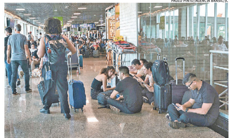
Passageiros enfrentaram filas, atrasos e remarcações de voos

O diretor-presidente da Agência Nacional de Aviação Civil (Anac), Tiago Faienstein, afirmou nesta quinta-feira que não existe risco de que o espaço aéreo de São Paulo volte a ser fechado. Segundo ele, a reabertura, por volta das 10h09, é um sinal de que o problema que causou o fechamento do espaço foi resolvido. O espaço ficou fechado devido a uma pane técnica na região.