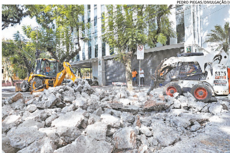
Reforma tem previsão de conclusão após 30 dias de trabalho

“O Brique fez 48 anos, e já há algum tempo estamos tratando junto com os feirantes e com os expositores para que possamos ter sucesso em qualificar aquele ambiente. Acredito que seja um grande presente não só para cidade, mas também para as pessoas que fazem daquele espaço um símbolo de Porto Alegre”, relata Fleck.