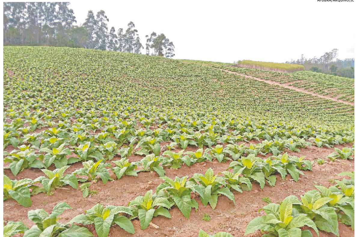
Medida atingirá indiretamente os produtores de tabaco por eventuais retrações do mercado formal