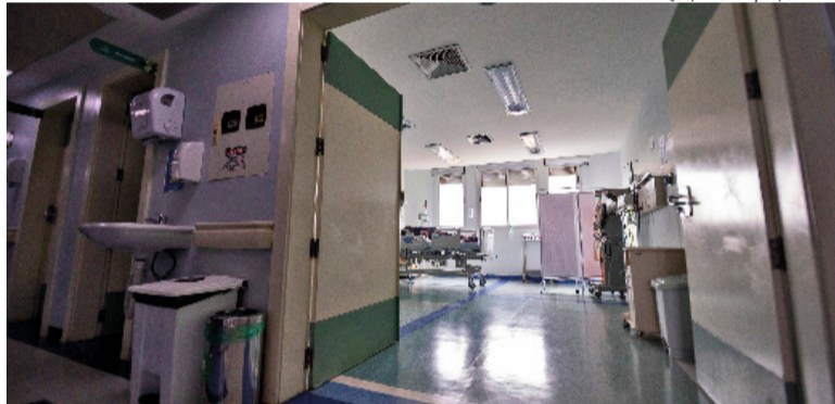
Foram investidos cerca de R$ 100 mil para melhorias na aparelhagem e no ambiente