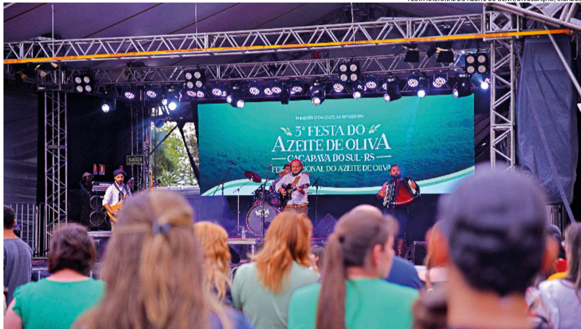
Festividade está programado para o início de maio; além do protagonista da festa, carne ovina também será presença marcante