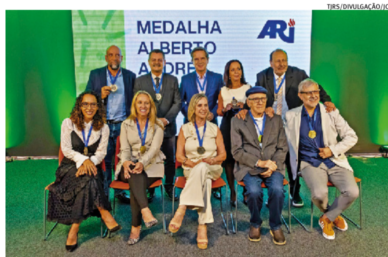
Medalha Alberto André reconhece trajetória de jornalistas gaúchos